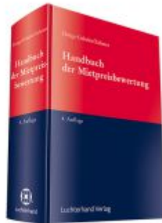
Handbuch der Mietpreisbewertung für Wohn- und Gewerberaum Ladenpreis: 102,80EUR