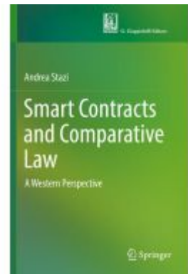
Smart Contracts and Comparative Law Ladenpreis: 142,99EUR