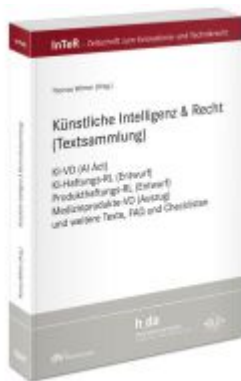
Künstliche Intelligenz & Recht (Textsammlung) Ladenpreis: 35,00EUR