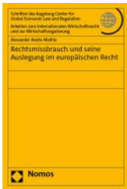
Rechtsmissbrauch und seine Auslegung im europäischen Recht Ladenpreis: 65,80EUR