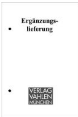
Bewertungsgesetz 38. Ergänzungslieferung Ladenpreis: 51,20EUR