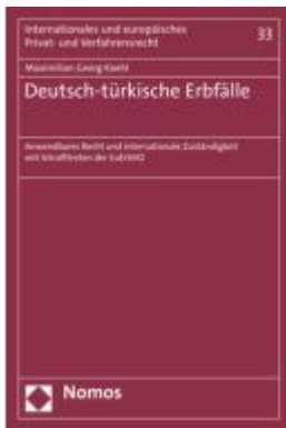
Deutsch-türkische Erbfälle Ladenpreis: 91,50EUR