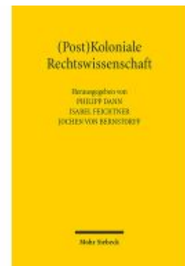
(Post)Koloniale Rechtswissenschaft Ladenpreis: 122,40EUR