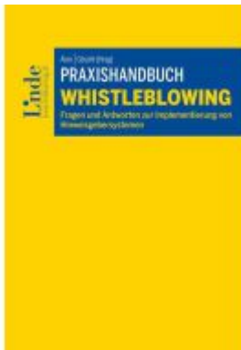
Praxishandbuch Whistleblowing Ladenpreis: 33,00EUR