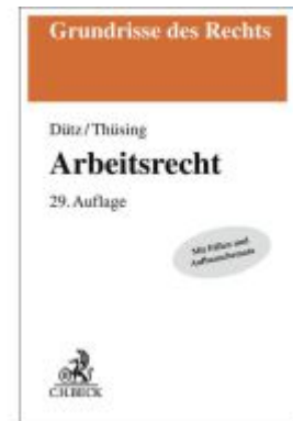
Arbeitsrecht Ladenpreis: 35,90EUR