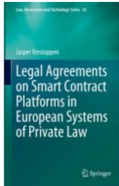
Legal Agreements on Smart Contract Platforms in European Systems of Private Law Ladenpreis: 175,99EUR