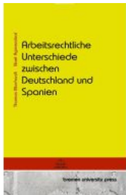
Arbeitsrechtliche Unterschiede zwischen Deutschland und Spanien Ladenpreis: 30,90EUR