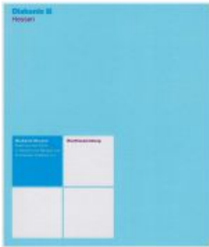
Rechtssammlung der Diakonie Hessen Ladenpreis: 237,50EUR