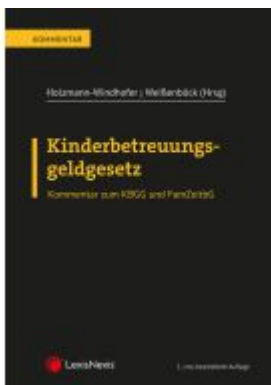
Kinderbetreuungsgeldgesetz Ladenpreis: 82,00EUR