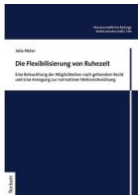
Die Flexibilisierung von Ruhezeit Ladenpreis: 76,10EUR