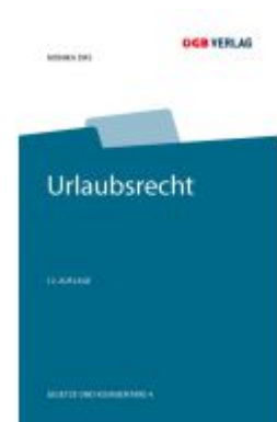
Urlaubsrecht Ladenpreis: 109,00EUR