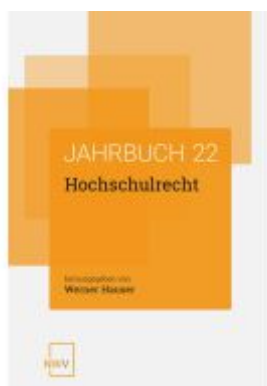
Hochschulrecht Ladenpreis: 68,00EUR