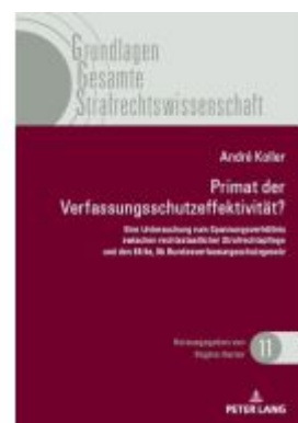
Primat der Verfassungsschutzeffektivität Ladenpreis: 74,00EUR