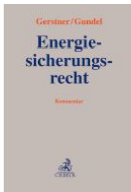
Energiesicherungsrecht Ladenpreis: 194,30EUR

Wir haben andere Produkte gefunden, die Ihnen gefallen könnten!