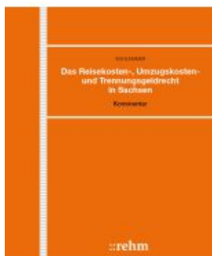
Das Reisekosten-, Umzugskosten- und Trennungsgeldrecht in Sachsen Ladenpreis: 522,30EUR