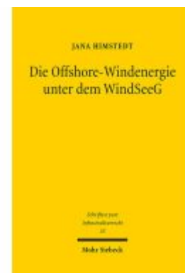
Die Offshore-Windenergie unter dem WindSeeG Ladenpreis: 91,50EUR