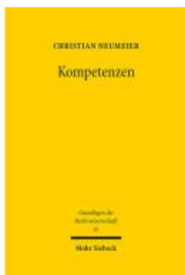
Kompetenzen Ladenpreis: 122,40EUR