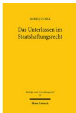
Das Unterlassen im Staatshaftungsrecht Ladenpreis: 91,50EUR