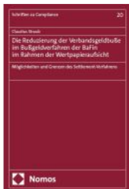
Die Reduzierung der Verbandsgeldbuße im Bußgeldverfahren der BaFin im Rahmen der Wertpapieraufsicht Ladenpreis: 112,10EUR