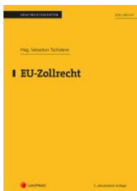
EU-Zollrecht (Skriptum) Ladenpreis: 43,75EUR