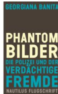
Phantombilder Ladenpreis: 24,70EUR