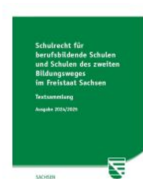
Schulrecht für berufsbildende Schulen und Schulen des zweiten Bildungsweges im Freistaat Sachsen Ladenpreis: 21,50EUR

Wir haben andere Produkte gefunden, die Ihnen gefallen könnten!