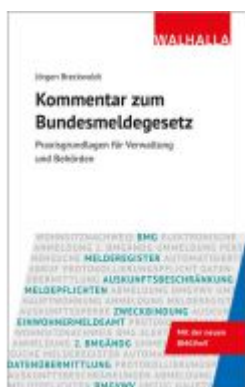
Kommentar zum Bundesmeldegesetz Ladenpreis: 82,20EUR