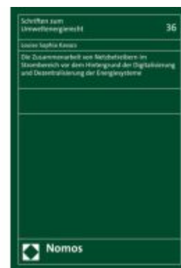
Die Zusammenarbeit von Netzbetreibern im Strombereich vor dem Hintergrund der Digitalisierung und Dezentralisierung der Energiesysteme Ladenpreis: 107,00EUR