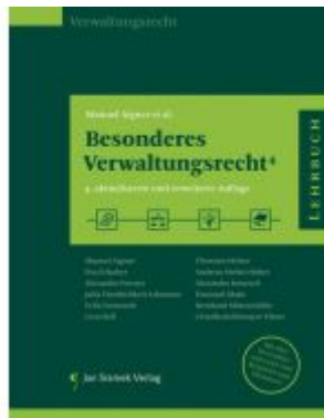
SET Fallbuch Öffentliches Recht und Besonderes Verwaltungsrecht 4. Auflage Ladenpreis: 78,00EUR