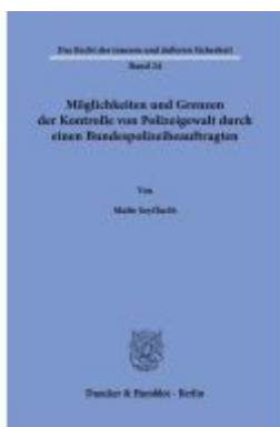
Möglichkeiten und Grenzen der Kontrolle von Polizeigewalt durch einen Bundespolizeibeauftragten. Ladenpreis: 92,50EUR