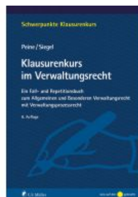
Klausurenkurs im Verwaltungsrecht Ladenpreis: 29,90EUR