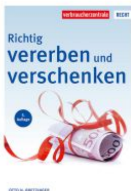
Richtig vererben und verschenken Ladenpreis: 20,60EUR