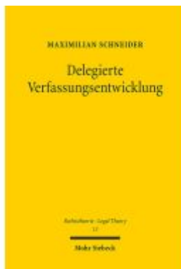
Delegierte Verfassungsentwicklung Ladenpreis: 96,70EUR