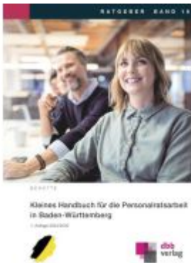
Kleines Handbuch für die Personalratsarbeit in Baden-Württemberg Ladenpreis: 20,50EUR