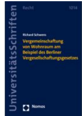
Vergemeinschaftung von Wohnraum am Beispiel des Berliner Vergesellschaftungsgesetzes Ladenpreis: 91,50EUR