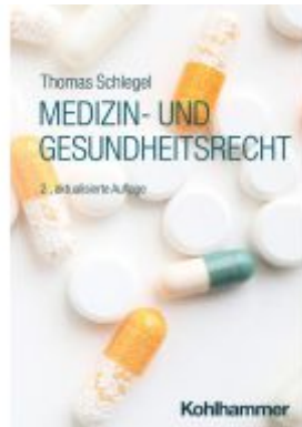
Medizin- und Gesundheitsrecht Ladenpreis: 26,70EUR