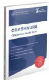
CRASHKURS Öffentliches Recht - Berlin Ladenpreis: 26,70EUR