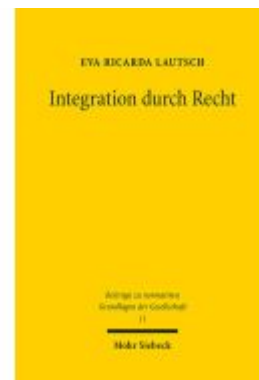
Integration durch Recht Ladenpreis: 96,70EUR