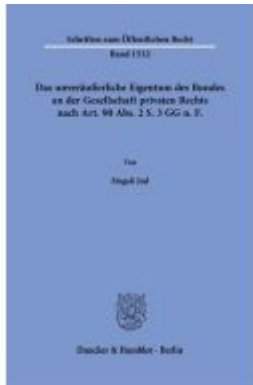
Das unveräußerliche Eigentum des Bundes an der Gesellschaft privaten Rechts nach Art. 90 Abs. 2 S. 3 GG n.F. Ladenpreis: 113,00EUR