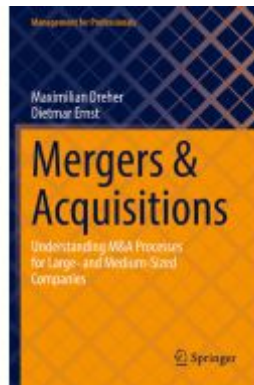
Mergers & Acquisitions Ladenpreis: 65,99EUR