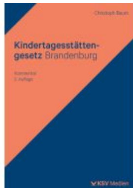
Kindertagesstätten-gesetz Brandenburg Ladenpreis: 36,00EUR