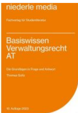
Basiswissen Verwaltungsrecht AT - 2023 Ladenpreis: 10,20EUR