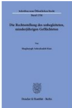
Die Rechtsstellung des unbegleiteten, minderjährigen Geflüchteten Ladenpreis: 102,70EUR