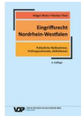
Eingriffsrecht Nordrhein-Westfalen Ladenpreis: 30,80EUR