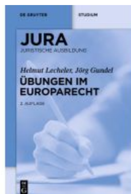
Übungen im Europarecht Ladenpreis: 19,95EUR