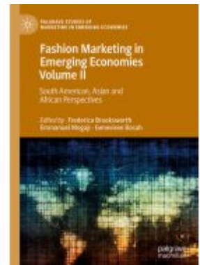
Fashion Marketing in Emerging Economies Volume II Ladenpreis: 175,99EUR