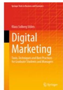
Digital Marketing Ladenpreis: 120,99EUR