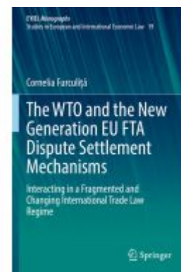
The WTO and the New Generation EU FTA Dispute Settlement Mechanisms Ladenpreis: 153,99EUR