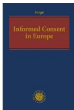
Informed Consent in Europe Ladenpreis: 123,40EUR