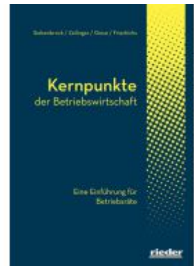
Kernpunkte der Betriebswirtschaft Ladenpreis: 46,30EUR