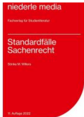
Standardfälle Sachenrecht - 2022 Ladenpreis: 12,30EUR