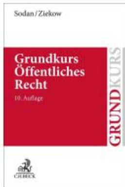
Grundkurs Öffentliches Recht Ladenpreis: 39,00EUR