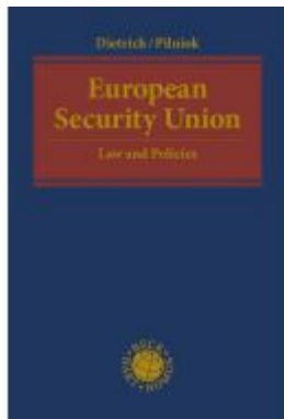
European Security Union Ladenpreis: 185,10EUR