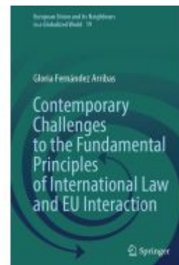
Contemporary Challenges to the Fundamental Principles of International Law and EU Interaction Ladenpreis: 153,99EUR