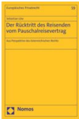
Der Rücktritt des Reisenden vom Pauschalreisevertrag Ladenpreis: 65,80EUR