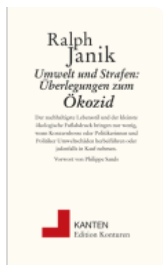
Umwelt und Strafe: Überlegungen zum Ökozid Ladenpreis: 12,00EUR