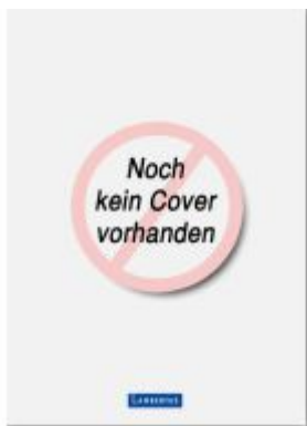
Schriftenreihe zum Kirchlichen Arbeitsrecht - Band 16 Ladenpreis: 61,60EUR