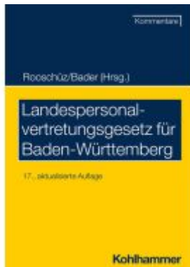
Landespersonalvertretungsgesetz für Baden-Württemberg Ladenpreis: 59,60EUR