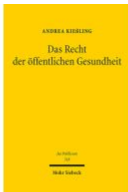
Das Recht der öffentlichen Gesundheit Ladenpreis: 122,40EUR