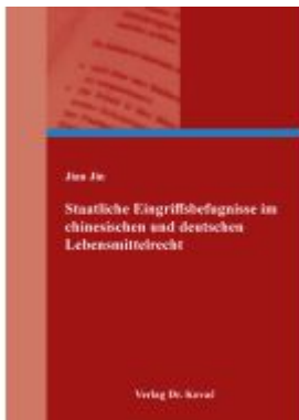
Staatliche Eingriffsbefugnisse im chinesischen und deutschen Lebensmittelrecht Ladenpreis: 91,40EUR

Wir haben andere Produkte gefunden, die Ihnen gefallen könnten!