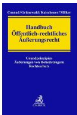
Handbuch Öffentlich-rechtliches Äußerungsrecht Ladenpreis: 122,40EUR