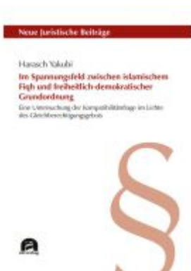
Im Spannungsfeld zwischen islamischem Fiqh und freiheitlich-demokratischer Grundordnung Ladenpreis: 60,70EUR