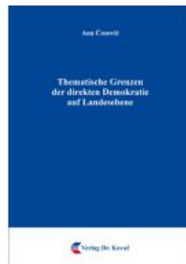
Thematische Grenzen der direkten Demokratie auf Landesebene Ladenpreis: 91,40EUR