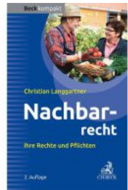
Nachbarrecht Ladenpreis: 12,30EUR