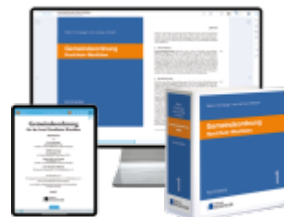
Gemeindeordnung Nordrhein-Westfalen – Print + Digital Ladenpreis: 255,00EUR