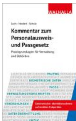
Kommentar zum Personalausweis- und Passgesetz Ladenpreis: 72,00EUR