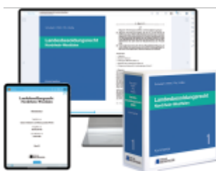
Landesbesoldungsrecht Nordrhein- Westfalen – Print + Digital Ladenpreis: 217,00EUR