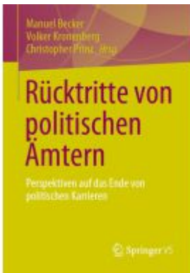
Rücktritte von politischen Ämtern Ladenpreis: 77,09EUR