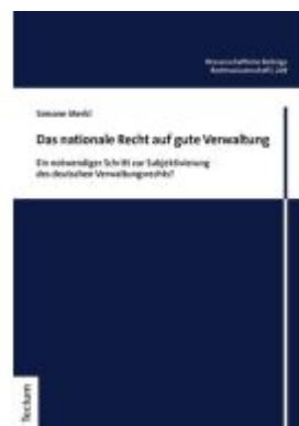
Das nationale Recht auf gute Verwaltung Ladenpreis: 91,50EUR