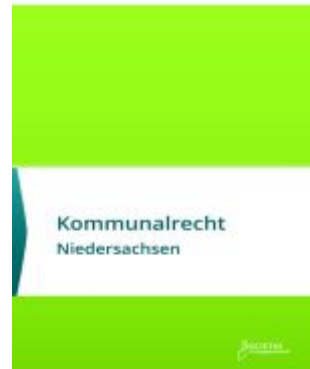
Kommunalrecht Niedersachsen Ladenpreis: 30,90EUR