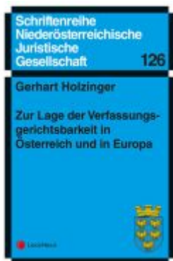
Zur Lage der Verfassungsgerichtsbarkeit in Österreich und in Europa Ladenpreis: 9,00EUR

Wir haben andere Produkte gefunden, die Ihnen gefallen könnten!