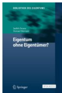
Eigentum ohne Eigentümer? Ladenpreis: 54,99EUR