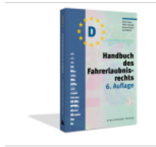
Handbuch des Fahrerlaubnisrechts