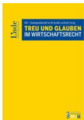
Treu und Glauben im Wirtschaftsrecht Ladenpreis: 62,00EUR