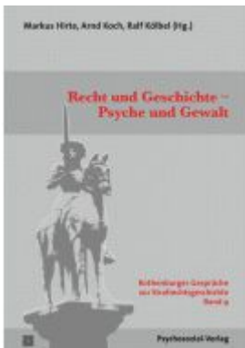
Recht und Geschichte – Psyche und Gewalt Ladenpreis: 35,90EUR