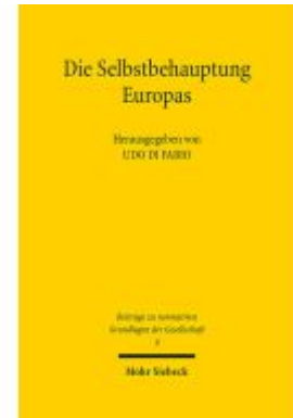
Die Selbstbehauptung Europas