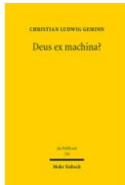
Deus ex machina? Ladenpreis: 148,10EUR