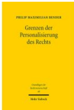
Grenzen der Personalisierung des Rechts Ladenpreis: 122,40EUR