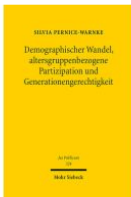
Demographischer Wandel, altersgruppenbezogene Partizipation und Generationengerechtigkeit Ladenpreis: 127,50EUR