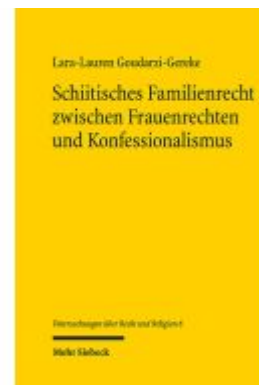
Schiitisches Familienrecht zwischen Frauenrechten und Konfessionalismus Ladenpreis: 91,50EUR