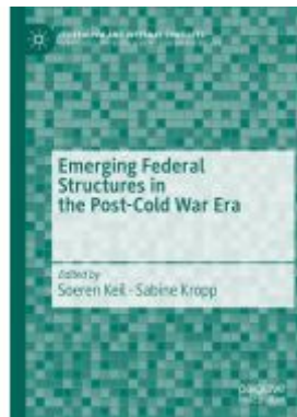
Emerging Federal Structures in the Post- Cold War Era Ladenpreis: 153,99EUR