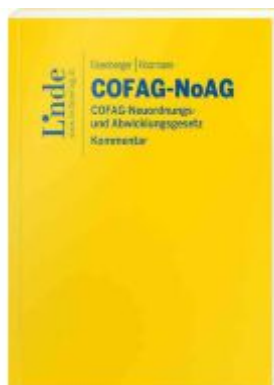
COFAG-NoAG | COFAG-Neuordnungs- und Abwicklungsgesetz Ladenpreis: 36,00EUR