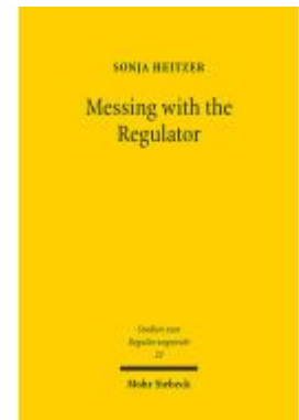
Messing with the Regulator Ladenpreis: 96,70EUR