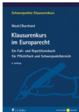
Klausurenkurs im Europarecht Ladenpreis: 30,90EUR