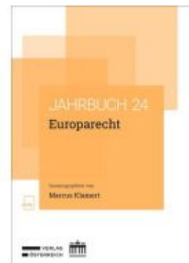
Jahrbuch Europarecht 2024 Ladenpreis: 86,40EUR