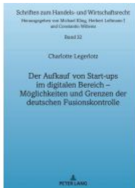
Der Aufkauf von Start-ups im digitalen Bereich Ladenpreis: 61,05EUR