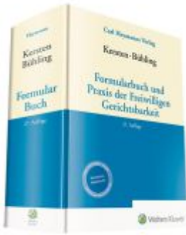
Formularbuch und Praxis der Freiwilligen Gerichtsbarkeit Ladenpreis: 338,30EUR