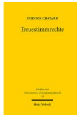
Treuestimmrechte Ladenpreis: 101,80EUR