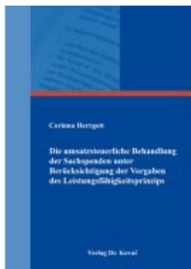
Die umsatzsteuerliche Behandlung der Sachspenden unter Berücksichtigung der Vorgaben des Leistungsfähigkeitsprinzips Ladenpreis: 88,30EUR