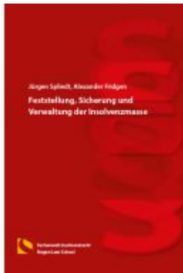
Feststellung, Sicherung und Verwaltung der Insolvenzmasse Ladenpreis: 16,40EUR