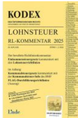
KODEX Lohnsteuer Richtlinien-Kommentar 2025 Ladenpreis: 64,00EUR