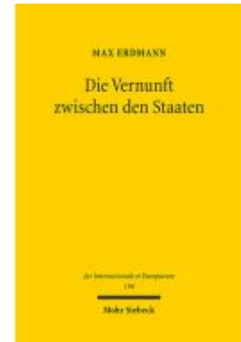
Die Vernunft zwischen den Staaten Ladenpreis: 101,80EUR