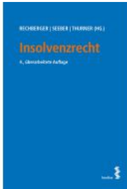
Insolvenzrecht Ladenpreis: 36,00EUR

Wir haben andere Produkte gefunden, die Ihnen gefallen könnten!