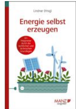
Energie selbst erzeugen Ladenpreis: 23,80EUR