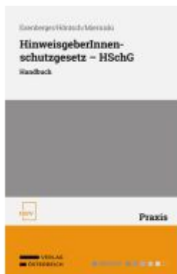
HinweisgeberInnenschutzgesetz – HSchG Ladenpreis: 78,00EUR