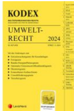
KODEX Umweltrecht 2024 - inkl. App Ladenpreis: 109,00EUR