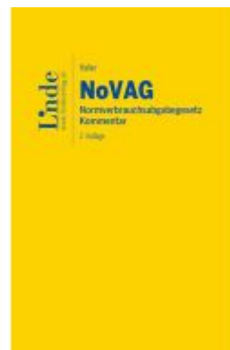
NoVAG | Normverbrauchsabgabengesetz Ladenpreis: 89,00EUR