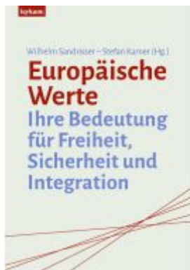
Europäische Werte Ladenpreis: 40,00EUR