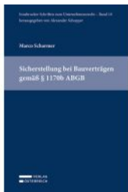
Sicherstellung bei Bauverträgen gemäß § 1170b ABGB Ladenpreis: 69,00EUR