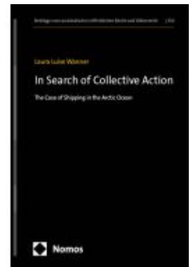
In Search of Collective Action Ladenpreis: 142,90EUR