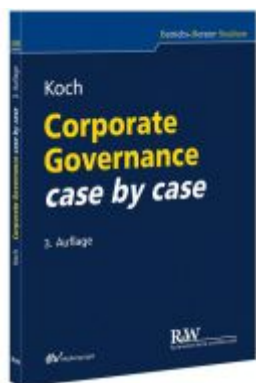
Corporate Governance case by case Ladenpreis: 29,90EUR