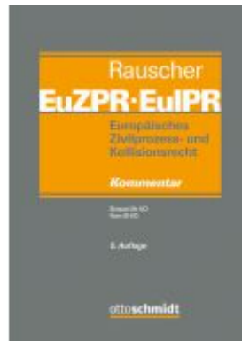
Europäisches Zivilprozess- und Kollisionsrecht EuZPR/EuIPR, Band IV/I Ladenpreis: 225,20EUR