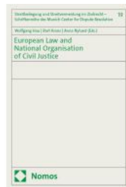
European Law and National Organisation of Civil Justice Ladenpreis: 60,70EUR