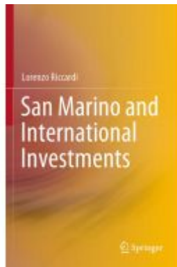
San Marino and International Investments Ladenpreis: 164,99EUR