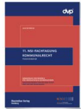
11. NSI-Fachtagung Kommunalrecht Ladenpreis: 25,70EUR