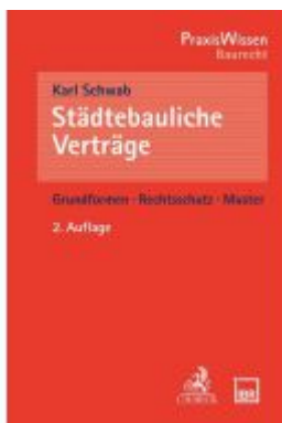
Städtebauliche Verträge Ladenpreis: 50,40EUR