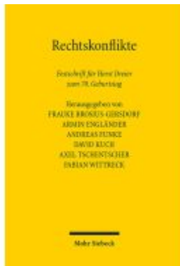
Rechtskonflikte Ladenpreis: 230,30EUR