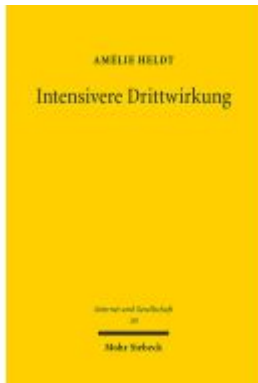
Intensivere Drittwirkung Ladenpreis: 86,40EUR