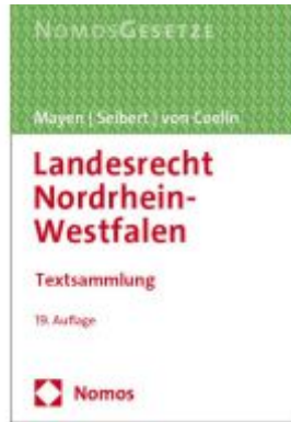
Landesrecht Nordrhein-Westfalen Ladenpreis: 30,80EUR