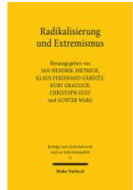
Radikalisierung und Extremismus Ladenpreis: 86,40EUR