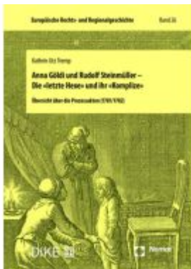
Anna Göldi und Rudolf Steinmüller – Die «letzte Hexe» und ihr «Komplize» Ladenpreis: 47,30EUR