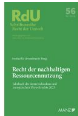
Recht der nachhaltigen Ressourcennutzung Jahrbuch des österreichischen und europäischen Umweltrechts 2023 Ladenpreis: 58,00EUR