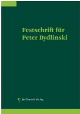
Festschrift für Peter Bydlinski Ladenpreis: 198,00EUR