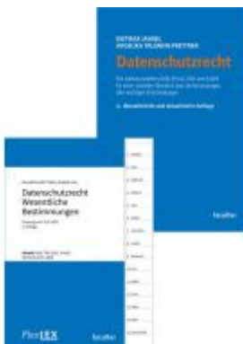
Kombipaket Datenschutzrecht und FlexLex Datenschutzrecht – Wesentliche Bestimmungen Ladenpreis: 48,00EUR