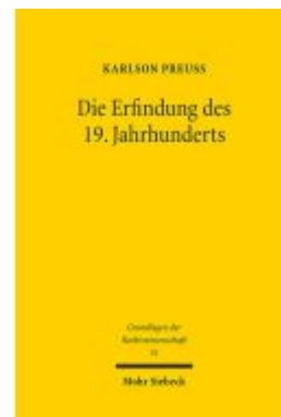
Die Erfindung des 19. Jahrhunderts Ladenpreis: 91,50EUR