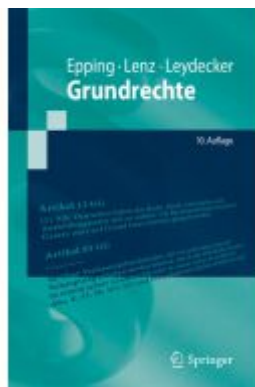
Grundrechte Ladenpreis: 25,69EUR