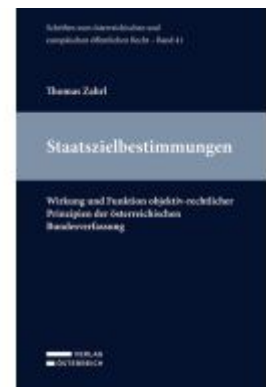
Staatszielbestimmungen Ladenpreis: 69,00EUR