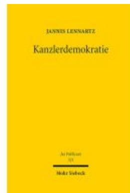
Kanzlerdemokratie Ladenpreis: 117,20EUR