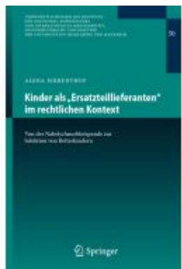
Kinder als „Ersatzteillieferanten“ im rechtlichen Kontext Ladenpreis: 92,51EUR