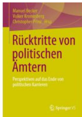
Rücktritte von politischen Ämtern Ladenpreis: 77,09EUR