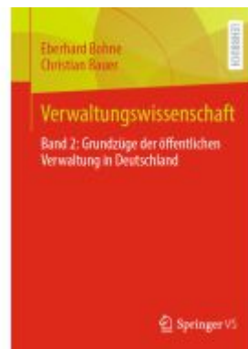
Verwaltungswissenschaft Ladenpreis: 41,11EUR