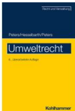
Umweltrecht Ladenpreis: 41,10EUR

Wir haben andere Produkte gefunden, die Ihnen gefallen könnten!