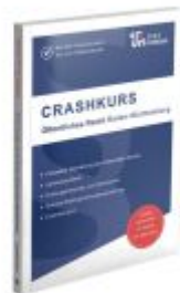
CRASHKURS Öffentliches Recht - Baden- Württemberg Ladenpreis: 28,70EUR