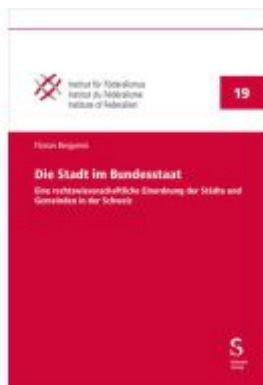
Die Stadt im Bundesstaat Ladenpreis: 108,20EUR