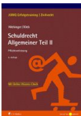
Schuldrecht Allgemeiner Teil II