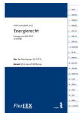
FlexLex Energierecht Ladenpreis: 48,00EUR