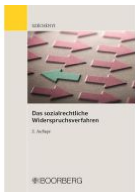
Das sozialrechtliche Widerspruchsverfahren