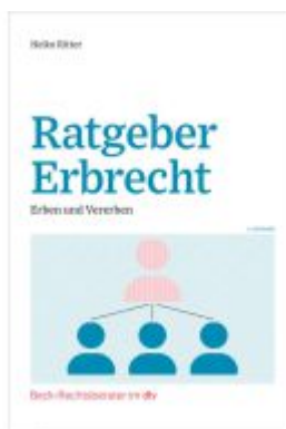
Ratgeber Erbrecht Ladenpreis: 25,60EUR