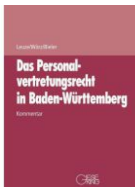
Das Personalvertretungsrecht in Baden-Württemberg Ladenpreis: 168,60EUR