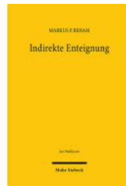
Indirekte Enteignung Ladenpreis: 128,50EUR