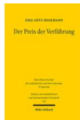
Der Preis der Verführung