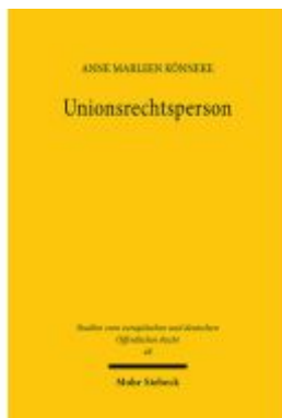
Unionsrechtsperson Ladenpreis: 96,70EUR