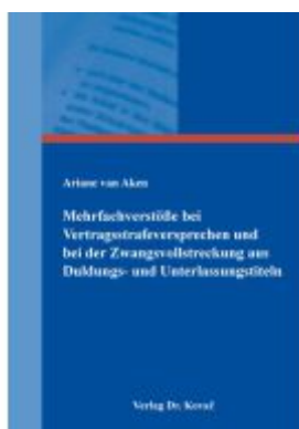
Mehrfachverstöße bei Vertragsstrafversprechen und bei der Zwangsvollstreckung aus Duldungs- und Unterlassungstiteln