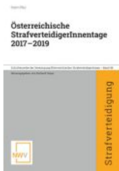
Österreichische StrafverteidigerInnenntage 2017 — 2019 Ladenpreis: 68,00EUR