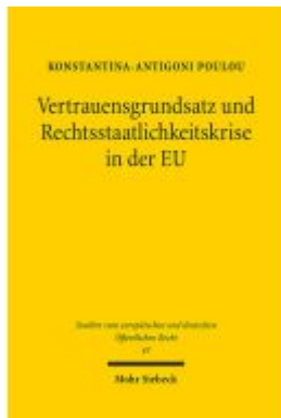
Vertrauensgrundsatz und Rechtsstaatlichkeitskrise in der EU Ladenpreis: 91,50EUR