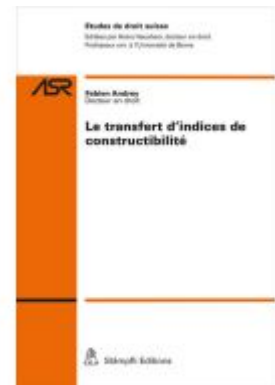
Le transfert d'indices de constructibilité Ladenpreis: 108,20EUR