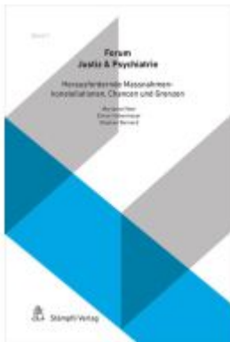
Herausfordernde Massnahmenkonstellationen, Chancen und Grenzen Ladenpreis: 80,00EUR