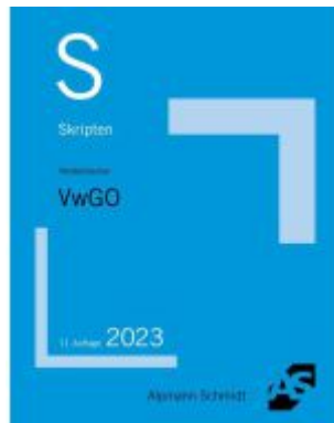
Skript VwGO Ladenpreis: 23,60EUR