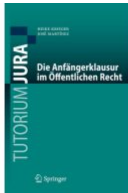
Die Anfängerklausur im Öffentlichen Recht Ladenpreis: 20,51EUR