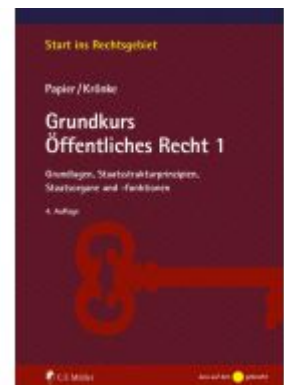
Grundkurs Öffentliches Recht 1 Ladenpreis: 25,70EUR