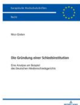
Die Gründung einer Schiedsinstitution Ladenpreis: 66,80EUR