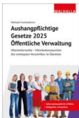
Aushangpflichtige Gesetze 2025 Öffentliche Verwaltung Ladenpreis: 14,95EUR