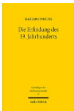
Die Erfindung des 19. Jahrhunderts Ladenpreis: 91,50EUR