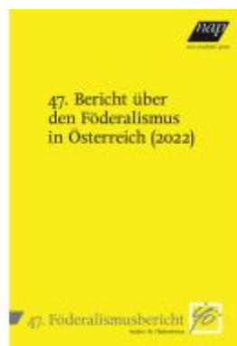
47. Bericht über den Föderalismus in Österreich (2022) Ladenpreis: 28,00EUR