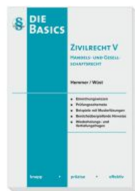
Basics Zivilrecht V - Handels- und Gesellschaftsrecht Ladenpreis: 20,50EUR