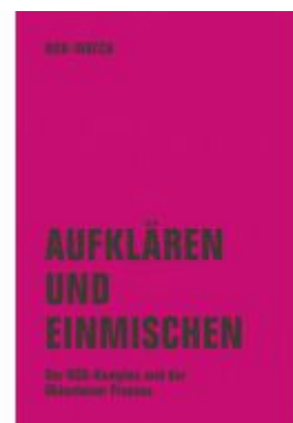
Aufklären und einmischen Ladenpreis: 20,60EUR