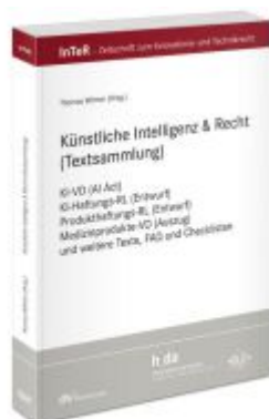
Künstliche Intelligenz & Recht (Textsammlung) Ladenpreis: 35,00EUR

Wir haben andere Produkte gefunden, die Ihnen gefallen könnten!