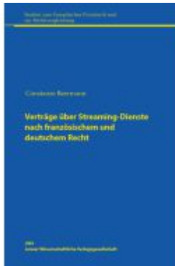
Verträge über Streaming-Dienste nach französischem und deutschem Recht Ladenpreis: 41,00EUR