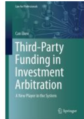
Third-Party Funding in Investment Arbitration Ladenpreis: 131,99EUR