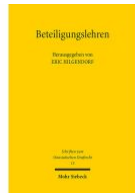
Beteiligungslehren Ladenpreis: 91,50EUR