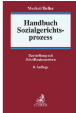
Handbuch Sozialgerichtsprozess Ladenpreis: 71,00EUR