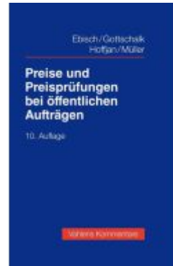
Preise und Preisprüfungen bei öffentlichen Aufträgen Ladenpreis: 132,70EUR