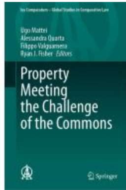
Property Meeting the Challenge of the Commons Ladenpreis: 252,99EUR