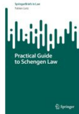
Practical Guide to Schengen Law Ladenpreis: 49,49EUR