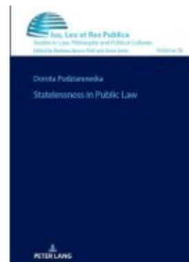
Statelessness in Public Law Ladenpreis: 61,60EUR