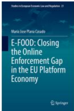
E-FOOD: Closing the Online Enforcement Gap in the EU Platform Economy Ladenpreis: 142,99EUR