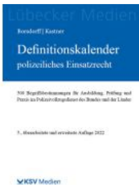
Definitionskalender polizeiliches Einsatzrecht Ladenpreis: 25,70EUR