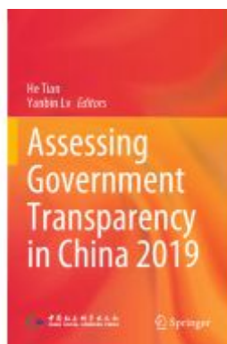
Assessing Government Transparency in China 2019 Ladenpreis: 109,99EUR