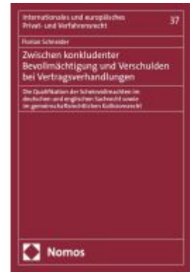
Zwischen konkludenter Bevollmächtigung und Verschulden bei Vertragsverhandlungen Ladenpreis: 132,70EUR