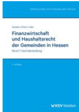
Finanzwirtschaft und Haushaltsrecht der Gemeinden in Hessen Ladenpreis: 46,30EUR