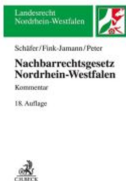
Nachbarrechtsgesetz Nordrhein-Westfalen Ladenpreis: 40,10EUR