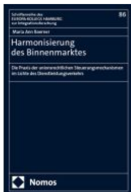
Harmonisierung des Binnenmarktes Ladenpreis: 194,30EUR