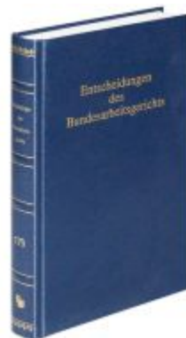
Entscheidungen des Bundesarbeitsgerichts (BAGE 179) Ladenpreis: 100,80EUR