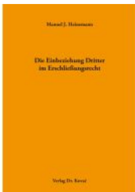
Die Einbeziehung Dritter im Erschließungsrecht Ladenpreis: 143,80EUR