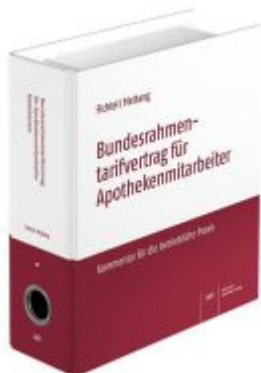
Bundesrahmentarifvertrag für Apothekenmitarbeiter Ladenpreis: 65,80EUR