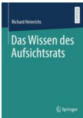
Das Wissen des Aufsichtsrats Ladenpreis: 102,79EUR