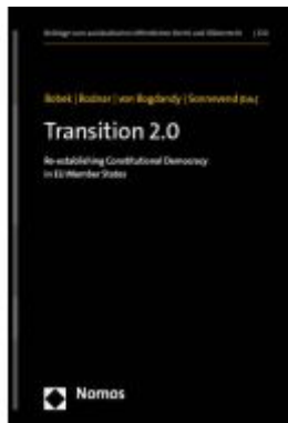
Transition 2.0 Ladenpreis: 184,10EUR