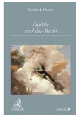
Goethe und das Recht Ladenpreis: 29,90EUR