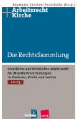
Die RechtsSammlung Ladenpreis: 41,20EUR

Wir haben andere Produkte gefunden, die Ihnen gefallen könnten!