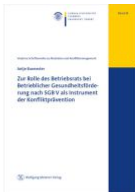
Zur Rolle des Betriebsrats bei Betrieblicher Gesundheitsförderung nach SGB V als Instrument der Konfliktprävention Ladenpreis: 20,50EUR