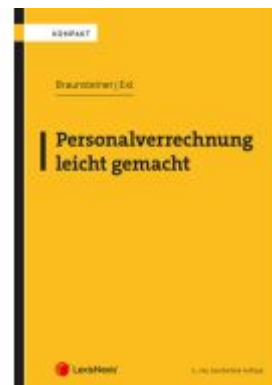
Personalverrechnung leicht gemacht Ladenpreis: 29,00EUR