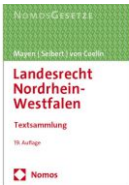
Landesrecht Nordrhein-Westfalen Ladenpreis: 30,80EUR