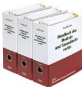
Handbuch des Medizin- und Gesundheitsrechts Ladenpreis: 178,90EUR