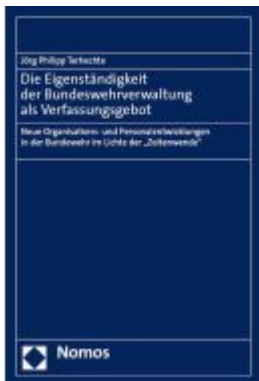
Die Eigenständigkeit der Bundeswehrverwaltung als Verfassungsgebot Ladenpreis: 50,40EUR