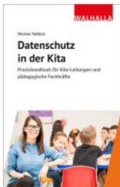
Datenschutz in der Kita Ladenpreis: 20,60EUR