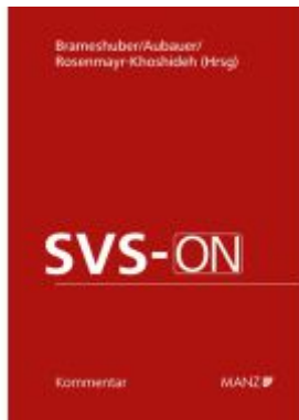
SVS-ON Ladenpreis: 418,00EUR