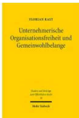
Unternehmerische Organisationsfreiheit und Gemeinwohlbelange Ladenpreis: 122,40EUR