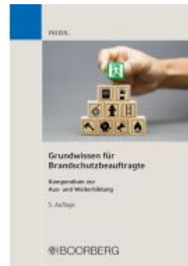
Grundwissen für Brandschutzbeauftragte Ladenpreis: 30,70EUR