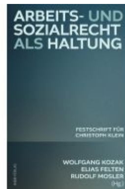
Arbeits- und Sozialrecht als Haltung Ladenpreis: 59,00EUR