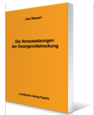
Die Voraussetzungen der Zwangsvollstreckung Ladenpreis: 25,70EUR