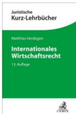
Internationales Wirtschaftsrecht Ladenpreis: 38,00EUR