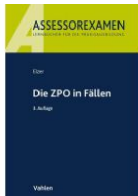
Die ZPO in Fällen Ladenpreis: 30,70EUR