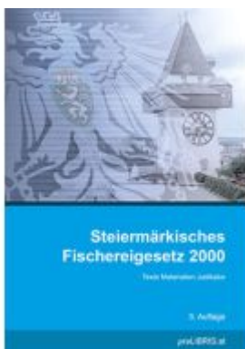
Steiermärkisches Fischereigesetz 2000 Ladenpreis: 13,00EUR