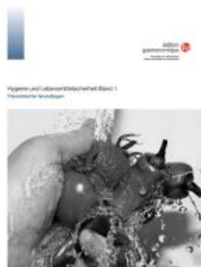
Hygiène et sécurité alimentaire vol. 1 Ladenpreis: 121,40EUR