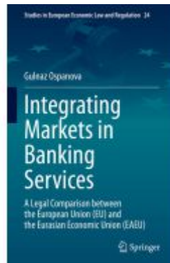
Integrating Markets in Banking Services Ladenpreis: 153,99EUR