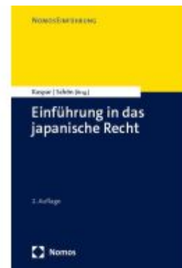
Einführung in das japanische Recht Ladenpreis: 30,80EUR