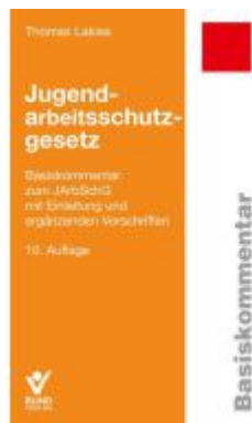
Jugendarbeitschutzgesetz Ladenpreis: 43,20EUR