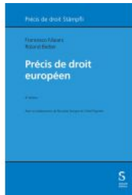
Précis de droit européen Ladenpreis: 185,80EUR