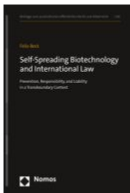
Self-Spreading Biotechnology and International Law Ladenpreis: 204,60EUR