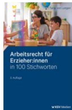
Arbeitsrecht für Erzieher:innen in 100 Stichworten Ladenpreis: 30,90EUR