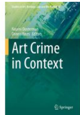
Art Crime in Context Ladenpreis: 164,99EUR