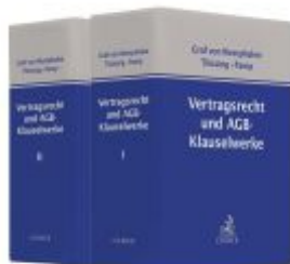
Vertragsrecht und AGB-Klauselwerke Ladenpreis: 204,60EUR