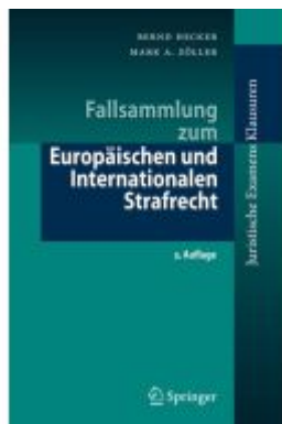
Fallsammlung zum Europäischen und Internationalen Strafrecht Ladenpreis: 33,92EUR