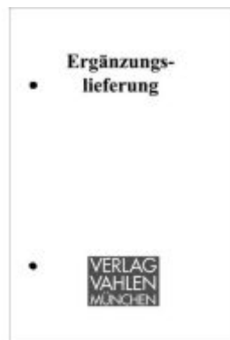
Betriebsrentenrecht (BetrAVG) Bd. 1: Arbeitsrecht 28. Ergänzungslieferung Ladenpreis: 54,50EUR