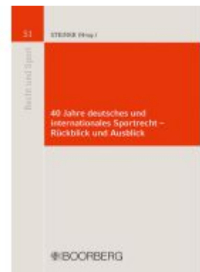
40 Jahre deutsches und internationales Sportrecht - Rückblick und Ausblick Ladenpreis: 30,70EUR