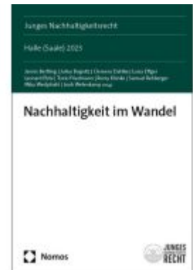
Nachhaltigkeit im Wandel Ladenpreis: 81,30EUR