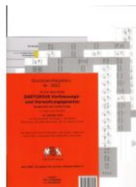
DürckheimRegister® SARTORIUS, Gesetze und §§, OHNE Stichworte Ladenpreis: 18,50EUR