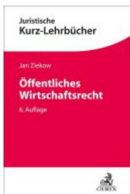
Öffentliches Wirtschaftsrecht Ladenpreis: 30,70EUR