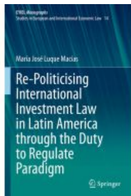
Re-Politicising International Investment Law in Latin America through the Duty to Regulate Paradigm Ladenpreis: 164,99EUR