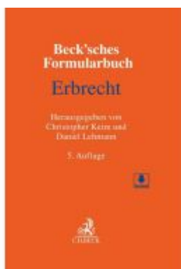
Beck'sches Formularbuch Erbrecht Ladenpreis: 153,20EUR