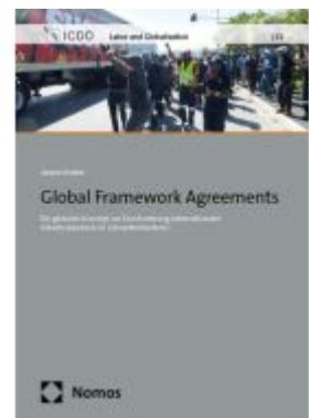
Global Framework Agreements Ladenpreis: 50,40EUR