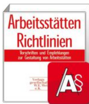
Arbeitsstätten Richtlinien mit Web-Version inklusive App Ladenpreis: 193,30EUR