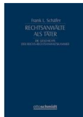
Rechtsanwälte als Täter Ladenpreis: 122,40EUR