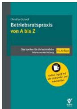
Betriebsratspraxis von A bis Z Ladenpreis: 60,70EUR