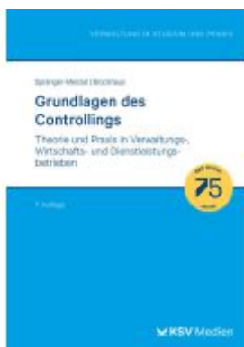
Grundlagen des Controllings Ladenpreis: 30,90EUR