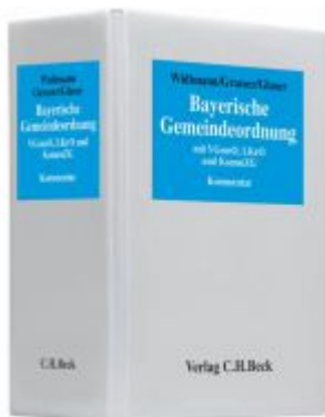
Bayerische Gemeindeordnung Ladenpreis: 101,80EUR

Wir haben andere Produkte gefunden, die Ihnen gefallen könnten!