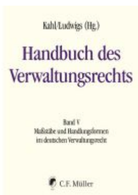
Handbuch des Verwaltungsrechts Ladenpreis: 308,50EUR