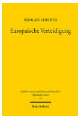
Europäische Verteidigung Ladenpreis: 86,40EUR