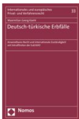
Deutsch-türkische Erbfälle Ladenpreis: 91,50EUR