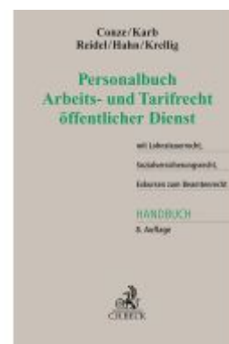
Personalbuch Arbeits- und Tarifrecht öffentlicher Dienst Ladenpreis: 97,70EUR