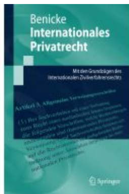
Internationales Privatrecht Ladenpreis: 25,65EUR