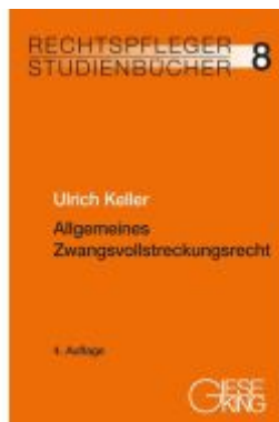
Allgemeines Zwangsvollstreckungsrecht Ladenpreis: 50,40EUR