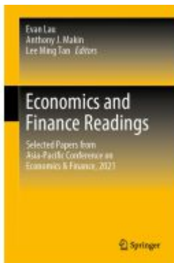
Economics and Finance Readings Ladenpreis: 197,99EUR