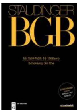
J. von Staudingers Kommentar zum Bürgerlichen Gesetzbuch mit Einführungsgesetz... / §§ 1564-1568b Ladenpreis: 199,95EUR