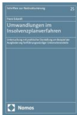
Umwandlungen im Insolvenzplanverfahren Ladenpreis: 153,20EUR