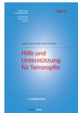
Hilfe und Unterstützung für Terroropfer Ladenpreis: 34,90EUR