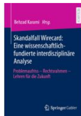
Skandalfall Wirecard: Eine wissenschaftlich-fundierte interdisziplinäre Analyse Ladenpreis: 102,80EUR