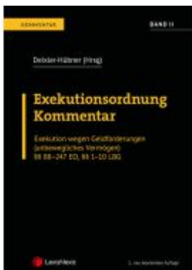
Exekutionsordnung - Kommentar Band 2 Ladenpreis: 214,00EUR

Wir haben andere Produkte gefunden, die Ihnen gefallen könnten!