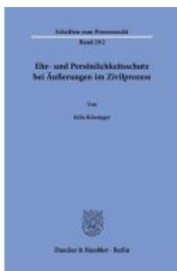
Ehr- und Persönlichkeitsschutz bei Äußerungen im Zivilprozess. Ladenpreis: 82,20EUR