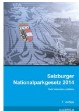
Salzburger Nationalparkgesetz 2014 Ladenpreis: 21,00EUR