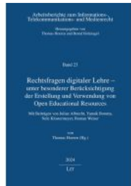
Rechtsfragen digitaler Lehre - unter besonderer Berücksichtigung der Erstellung und Verwendung von Open Educational Resources