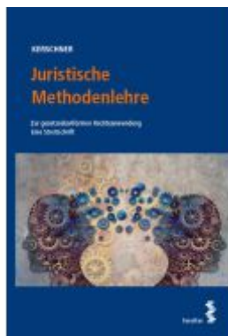
Juristische Methodenlehre Ladenpreis: 24,00EUR