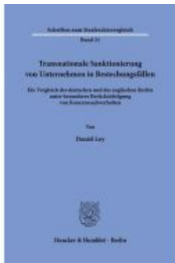
Transnationale Sanktionierung von Unternehmen in Bestechungsfällen.