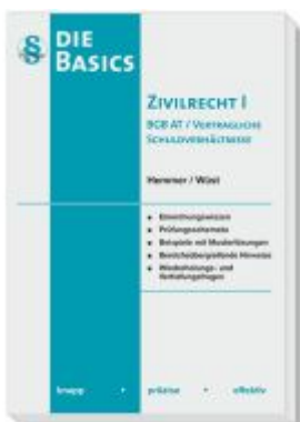
Basics Zivilrecht I - BGB AT und vertragliche Schuldverhältnisse Ladenpreis: 19,40EUR