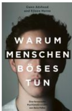
Warum Menschen Böses tun