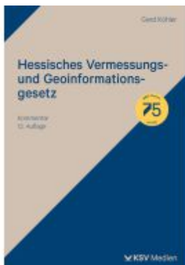
Hessisches Vermessungs- und Geoinformationsgesetz Ladenpreis: 71,00EUR