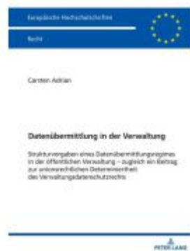
Datenübermittlung in der Verwaltung Ladenpreis: 77,10EUR