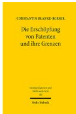
Die Erschöpfung von Patenten und ihre Grenzen Ladenpreis: 127,50EUR