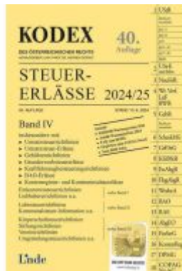
KODEX Steuer-Erlässe 2024/25, Band IV Ladenpreis: 67,00EUR