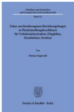
Erlasse von lärmbezogenen Betriebsregelungen in Planfeststellungsbeschlüssen für Verkehrsinfrastruktur (Flughäfen, Eisenbahnen, Straßen). Ladenpreis: 71,90EUR