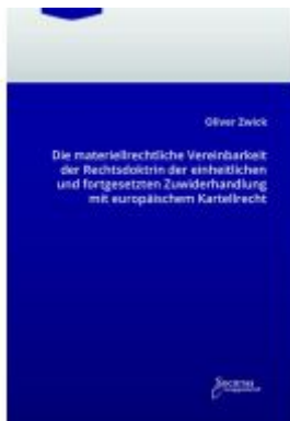
Die materiellrechtliche Vereinbarkeit der Rechtsdoctrin der einheitlichen und fortgesetzten Zuwiderhandlung mit europäischem Kartellrecht Ladenpreis: 30,70EUR