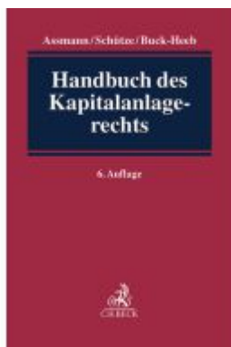
Handbuch des Kapitalanlage-rechts Ladenpreis: 214,90EUR