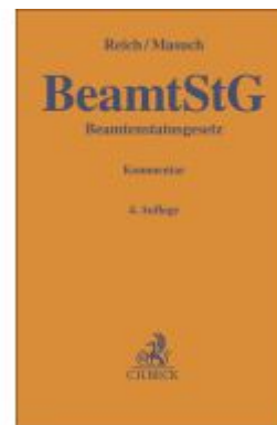
BeamtStG Ladenpreis: 101,80EUR