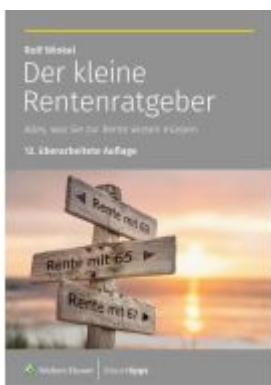
Der kleine Rentenratgeber Ladenpreis: 20,60EUR