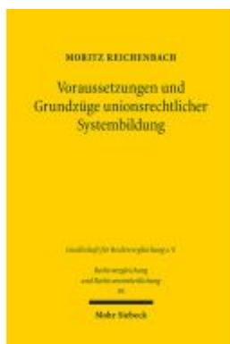
Voraussetzungen und Grundzüge unionsrechtlicher Systembildung Ladenpreis: 86,40EUR