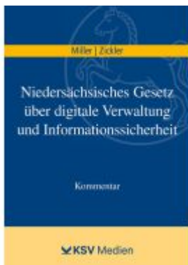
Niedersächsisches Gesetz über digitale Verwaltung und Informationssicherheit Ladenpreis: 32,90EUR