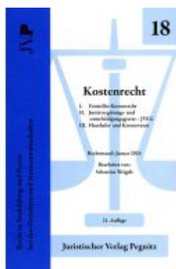
Kostenrecht - I. Formelles Kostenrecht II. JVEG III. Haushalts- und Kassenwesen Ladenpreis: 23,70EUR