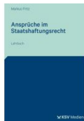
Ansprüche im Staatshaftungsrecht Ladenpreis: 40,10EUR