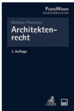
Architektenrecht Ladenpreis: 50,40EUR