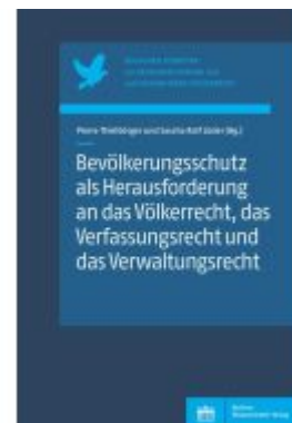
Bevölkerungsschutz als Herausforderung an das Völkerrecht, das Verfassungsrecht und das Verwaltungsrecht Ladenpreis: 32,90EUR