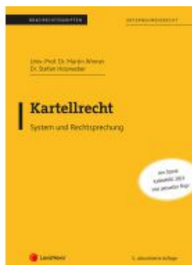
Kartellrecht (Skriptum) Ladenpreis: 27,50EUR