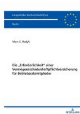
Die „Erforderlichkeit“ einer Vermögensschadenhaftpflichtversicherung für Betriebsratsmitglieder Ladenpreis: 66,80EUR