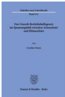
Das Umwelt-Rechtsbehelfsgesetz im Spannungsfeld zwischen Artenschutz und Klimaschutz Ladenpreis: 82,20EUR