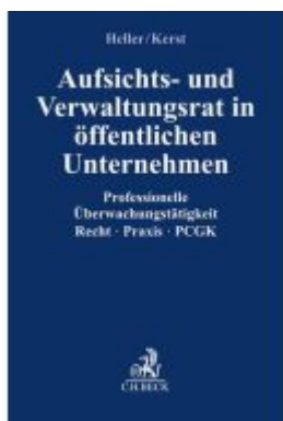
Aufsichts- und Verwaltungsrat im öffentlichen Unternehmen Ladenpreis: 112,10EUR