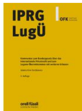
IPRG/LugÜ Kommentar Ladenpreis: 203,60EUR