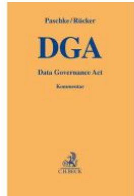
Data Governance Act Ladenpreis: 153,20EUR