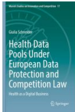
Health Data Pools Under European Data Protection and Competition Law Ladenpreis: 153,99EUR