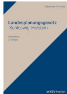
Landesplanungsgesetz Schleswig-Holstein Ladenpreis: 51,40EUR