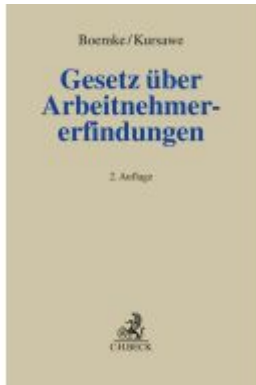
Gesetz über Arbeitnehmererfindungen Ladenpreis: 235,50EUR