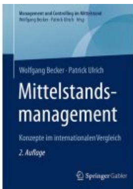
Mittelstandsmanagement Ladenpreis: 35,97EUR