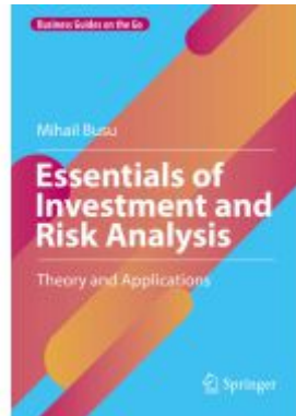
Essentials of Investment and Risk Analysis Ladenpreis: 43,99EUR