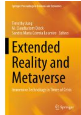
Extended Reality and Metaverse Ladenpreis: 197,99EUR