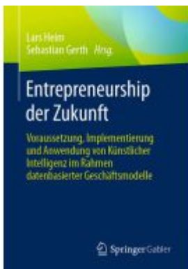
Entrepreneurship der Zukunft