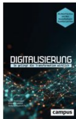
Digitalisierung Ladenpreis: 43,20EUR