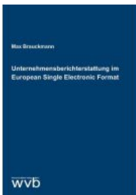
Unternehmensberichterstattung im European Single Electronic Format