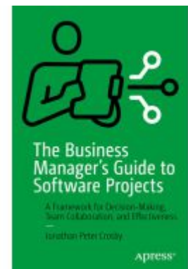
The Business Manager's Guide to Software Projects Ladenpreis: 49,49EUR