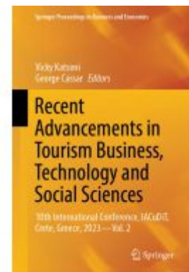
Recent Advancements in Tourism Business, Technology and Social Sciences