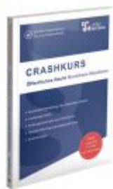
CRASHKURS Öffentliches Recht - NRW Ladenpreis: 28,70EUR