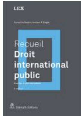
Recueil : Droit international public Ladenpreis: 151,70EUR