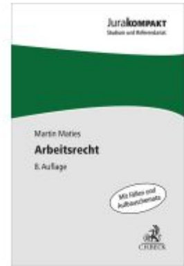
Arbeitsrecht Ladenpreis: 15,40EUR