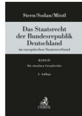
Das Staatsrecht der Bundesrepublik Deutschland im europäischen Staatenverbund Band IV: Die einzelnen Grundrechte Ladenpreis: 192,50EUR