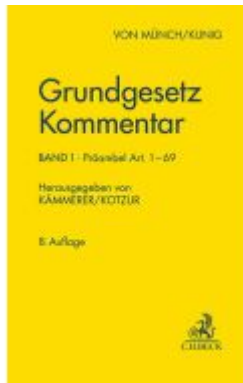
Grundgesetz-Kommentar Band 1: Präambel bis Art. 69 Ladenpreis: 184,60EUR