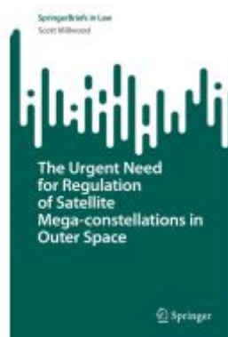
The Urgent Need for Regulation of Satellite Mega-constellations in Outer Space Ladenpreis: 54,99EUR