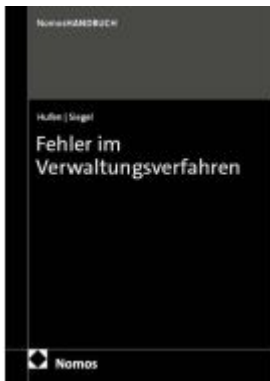
Fehler im Verwaltungsverfahren Ladenpreis: 91,50EUR

Wir haben andere Produkte gefunden, die Ihnen gefallen könnten!