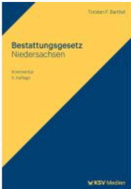
Bestattungsgesetz Niedersachsen Ladenpreis: 50,40EUR