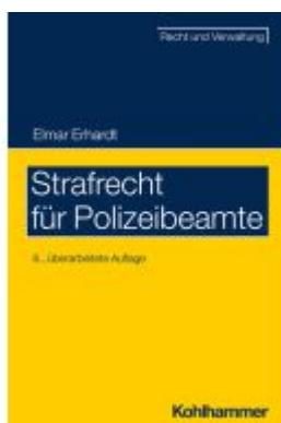
Strafrecht für Polizeibeamte