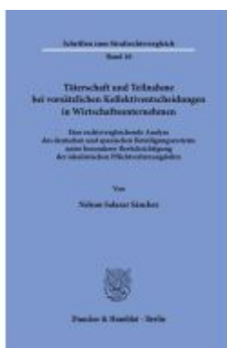
Täterschaft und Teilnahme bei vorsätzlichen Kollektiventscheidungen in Wirtschaftsunternehmen.