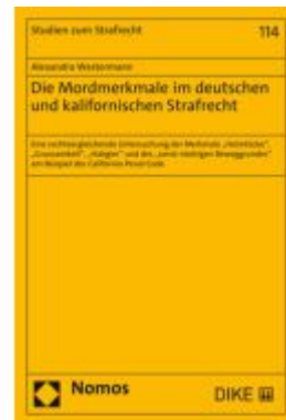
Die Mordmerkmale im deutschen und kalifornischen Strafrecht Ladenpreis: 86,40EUR