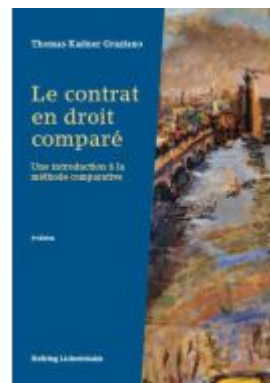
Le contrat en droit comparé Ladenpreis: 108,00EUR