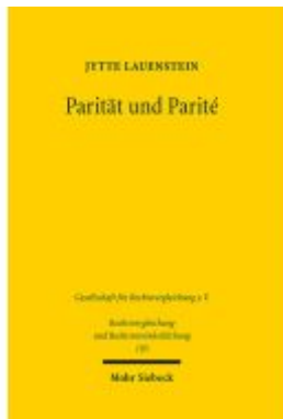
Parität und Parité Ladenpreis: 86,40EUR