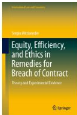
Equity, Efficiency, and Ethics in Remedies for Breach of Contract Ladenpreis: 131,99EUR