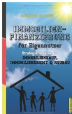
Immobilienfinanzierung für Eigennutzer Ladenpreis: 29,90EUR