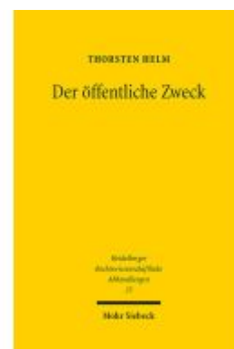
Der öffentliche Zweck