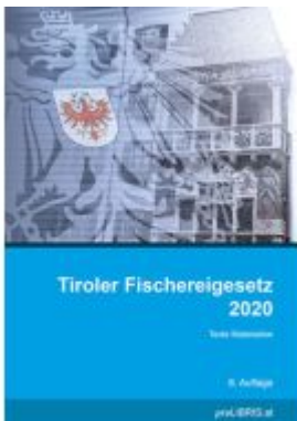
Tiroler Fischereigesetz 2020 Ladenpreis: 23,00EUR