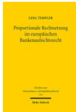
Proportionale Rechtsetzung im europäischen Bankenaufsichtsrecht Ladenpreis: 86,40EUR