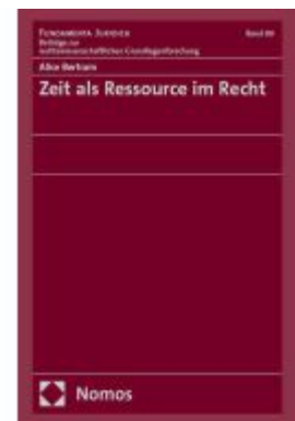
Zeit als Ressource im Recht Ladenpreis: 117,20EUR