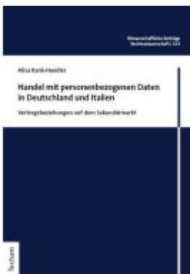
Handel mit personenbezogenen Daten in Deutschland und Italien Ladenpreis: 81,30EUR