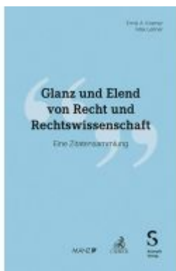
Glanz und Elend von Recht und Rechtswissenschaft Ladenpreis: 40,00EUR