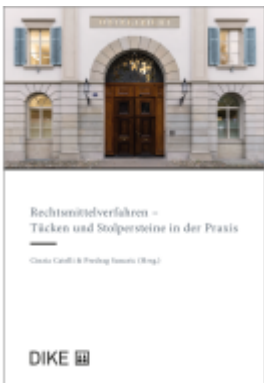
Rechtsmittelverfahren - Tücken und Stolpersteine in der Praxis Ladenpreis: 40,00EUR