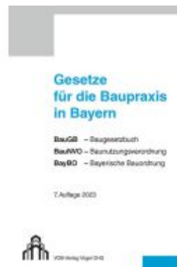
Gesetze für die Baupraxis in Bayern Ladenpreis: 22,50EUR