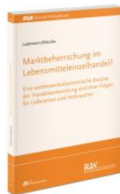
Marktbeherrschung im Lebensmitteleinzelhandel? Ladenpreis: 71,00EUR