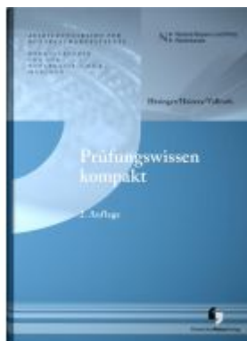
Prüfungswissen kompakt Ladenpreis: 25,60EUR