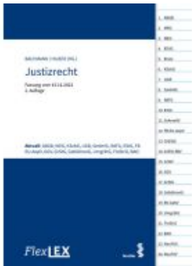
FlexLex Justizrecht Ladenpreis: 30,00EUR