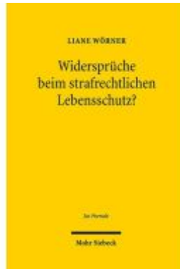
Widersprüche beim strafrechtlichen Lebensschutz? Ladenpreis: 118,30EUR