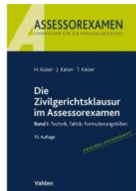
Die Zivilgerichtsklausur im Assessorexamen Ladenpreis: 25,60EUR