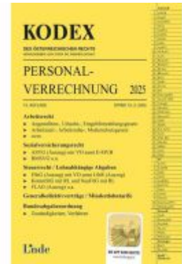
KODEX Personalverrechnung 2025 Ladenpreis: 48,00EUR