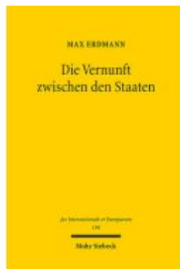
Die Vernunft zwischen den Staaten Ladenpreis: 101,80EUR