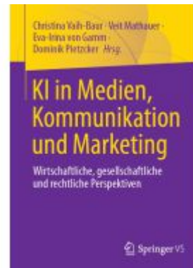
KI in Medien, Kommunikation und Marketing Ladenpreis: 92,51EUR