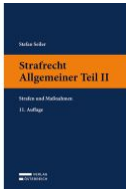
Strafrecht Allgemeiner Teil II Ladenpreis: 23,00EUR