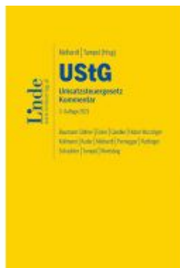
UStG | Umsatzsteuergesetz Ladenpreis: 330,00 EUR

Wir haben andere Produkte gefunden, die Ihnen gefallen könnten!