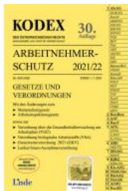
KODEX Arbeitnehmerschutz 2021/22 Ladenpreis: 38,00 EUR