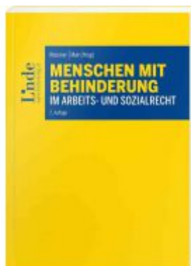
Menschen mit Behinderung im Arbeits- und Sozialrecht Ladenpreis: 35,00 EUR