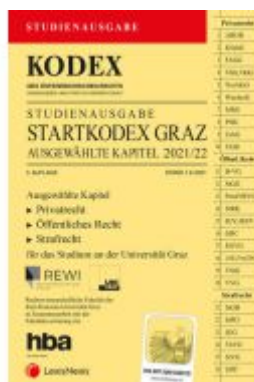
KODEX Startkodex Graz 2021/22 - inkl. App Ladenpreis: 19,00 EUR