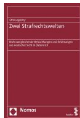
Zwei Strafrechtswelten Ladenpreis: 60,70 EUR