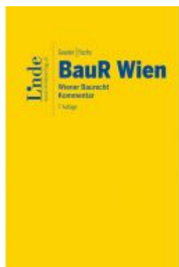
BauR Wien | Wiener Baurecht Ladenpreis: 120,00 EUR