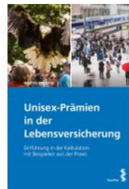
Unisex-Prämien in der Lebensversicherung Ladenpreis: 30,00 EUR