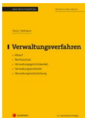
Verwaltungsverfahren (Skriptum) Ladenpreis: 21,00 EUR