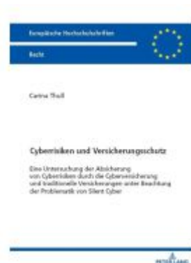
Cyberrisiken und Versicherungsschutz Ladenpreis: 63,70EUR