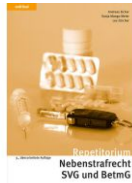
Repetitorium Nebenstrafrecht SVG und BetmG Ladenpreis: 71,00EUR