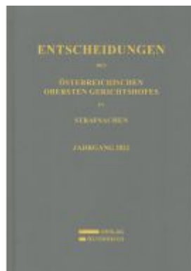
Entscheidungen des Österreichischen Obersten Gerichtshofes in Strafsachen Ladenpreis: 149,00EUR