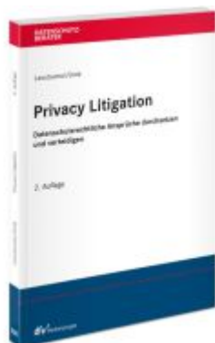
Privacy Litigation Ladenpreis: 91,50EUR