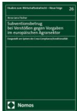
Subventionsbetrug bei Verstößen gegen Vorgaben im europäischen Agrarsektor Ladenpreis: 127,50EUR