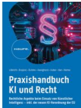
Praxishandbuch KI und Recht Ladenpreis: 72,00EUR