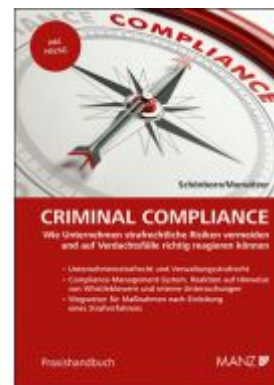
Criminal Compliance Ladenpreis: 128,00EUR