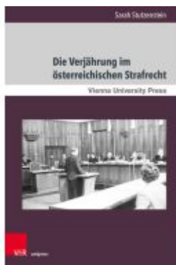
Die Verjährung im österreichischen Strafrecht Ladenpreis: 57,00EUR