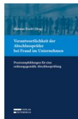
Verantwortlichkeit der Abschlussprüfer bei Fraud im Unternehmen Ladenpreis: 69,00EUR