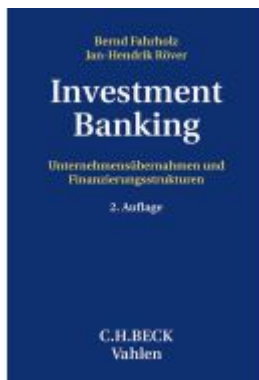
Investment Banking Ladenpreis: 132,70EUR