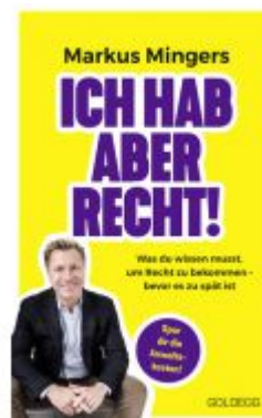
Ich hab aber recht! Was du wissen musst, um recht zu bekommen – bevor es zu spät ist. Häufige Rechtsirrtümer und praktisches Wissen zu Rechten im Alltag vom Spitzenanwalt erklärt Ladenpreis: 19,00EUR