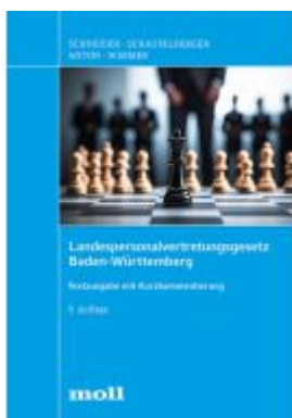
Landespersonalvertretungsgesetz Baden- Württemberg Ladenpreis: 55,60EUR