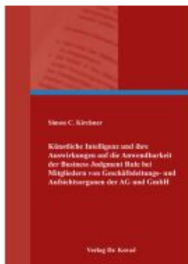
Künstliche Intelligenz und ihre Auswirkungen auf die Anwendbarkeit der Business Judgment Rule bei Mitgliedern von Geschäftsleitungs- und Aufsichtsräten der AG und GmbH Ladenpreis: 138,60EUR