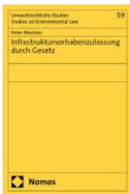
Infrastrukturvorhabenzulassung durch Gesetz Ladenpreis: 132,70EUR