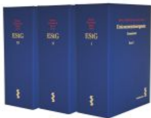
Einkommensteuergesetz inkl. 24. Ergänzungslieferung Ladenpreis: 390,00EUR