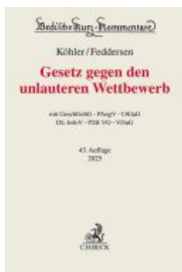
Gesetz gegen den unlauteren Wettbewerb Ladenpreis: 231,40EUR