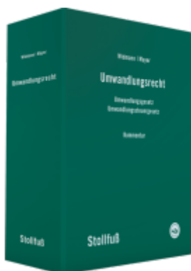
Umwandlungsrecht Kommentar Ladenpreis: 440,00EUR