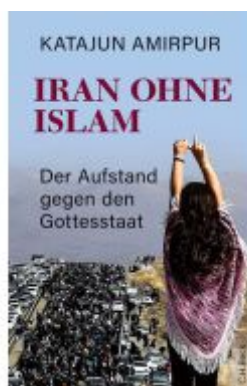
Iran ohne Islam Ladenpreis: 25,70EUR