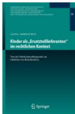
Kinder als „Ersatzteillieferanten“ im rechtlichen Kontext Ladenpreis: 92,51EUR