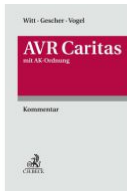
AVR Caritas inkl. AK-Ordnung Ladenpreis: 142,90EUR