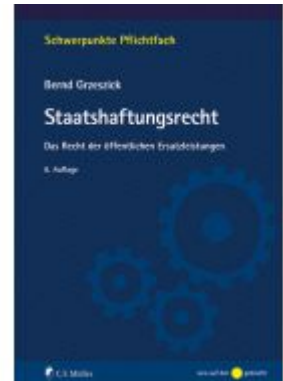
Staatshaftungsrecht Ladenpreis: 23,70EUR