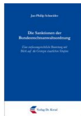
Die Sanktionen der Bundesrechtsanwaltsordnung Ladenpreis: 100,60EUR