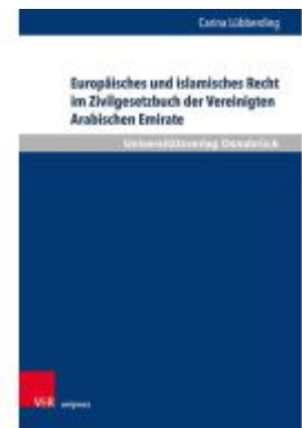
Europäisches und islamisches Recht im Zivilgesetzbuch der Vereinigten Arabischen Emirate Ladenpreis: 42,00EUR