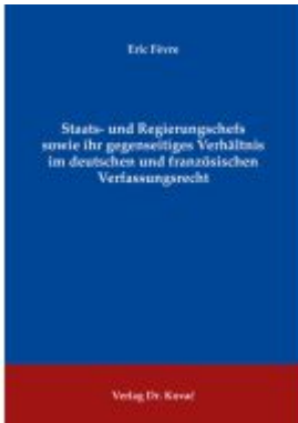
Staats- und Regierungschefs sowie ihr gegenseitiges Verhältnis im deutschen und französischen Verfassungsrecht Ladenpreis: 68,70EUR