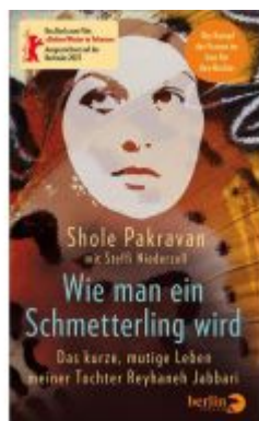
Wie man ein Schmetterling wird Ladenpreis: 24,70EUR