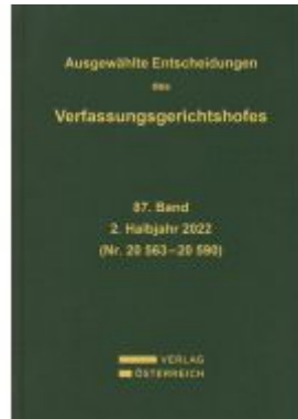
Ausgewählte Entscheidungen des Verfassungsgerichtshofes Ladenpreis: 299,00EUR