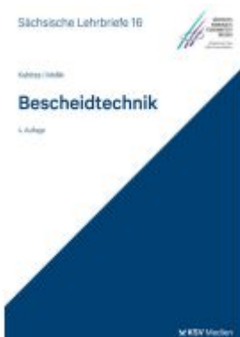
Bescheidtechnik (SL 16) Ladenpreis: 25,70EUR