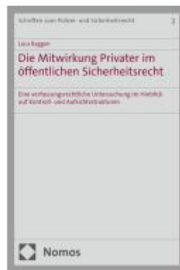
Die Mitwirkung Privater im öffentlichen Sicherheitsrecht Ladenpreis: 71,00EUR