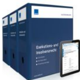
Mustersammlung Exekutions- und Insolvenzrecht Ladenpreis: 283,80EUR