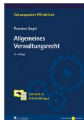
Allgemeines Verwaltungsrecht Ladenpreis: 28,80EUR