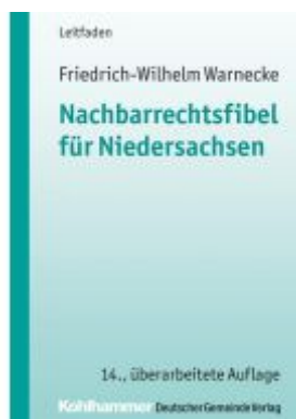
Nachbarrechtsfibel für Niedersachsen Ladenpreis: 22,70EUR