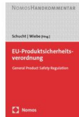
EU-Produktsicherheitsverordnung Ladenpreis: 122,40EUR