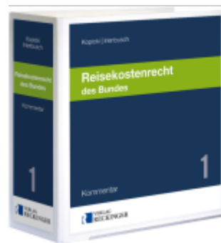
Reisekostenrecht des Bundes Ladenpreis: 142,90EUR