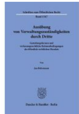
Ausübung von Verwaltungszuständigkeiten durch Dritte Ladenpreis: 82,20EUR