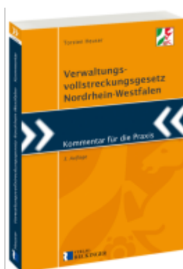
Verwaltungsvollstreckungsgesetz Nordrhein-Westfalen Ladenpreis: 51,30EUR