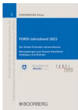
FORSI-Jahresband 2023 Ladenpreis: 45,30EUR