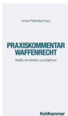
Praxiskommentar Waffenrecht Ladenpreis: 102,00EUR