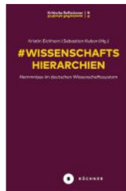
# Wissenschaftshierarchien Ladenpreis: 15,00EUR