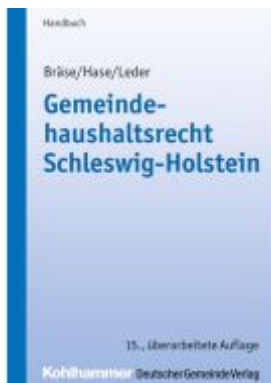
Gemeindehaushaltsrecht Schleswig- Holstein Ladenpreis: 96,70EUR