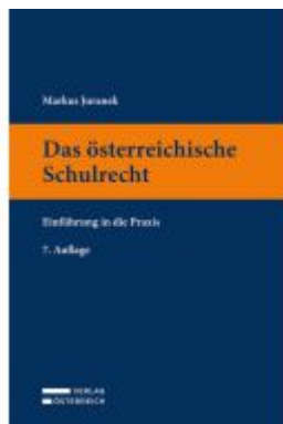
Das österreichische Schulrecht Ladenpreis: 54,00EUR