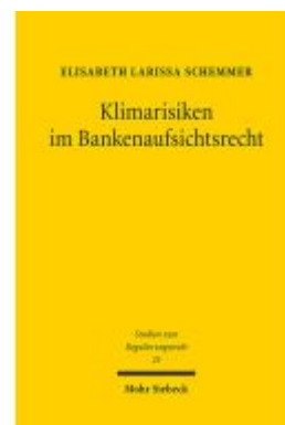
Klimarisiken im Bankenaufsichtsrecht Ladenpreis: 112,10EUR