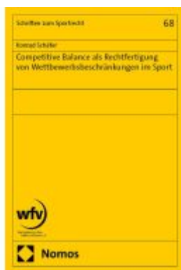
Competitive Balance als Rechtfertigung von Wettbewerbsbeschränkungen im Sport Ladenpreis: 122,40EUR