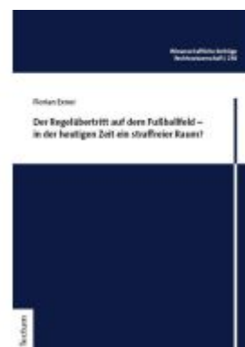
Der Regelübertritt auf dem Fußballfeld – in der heutigen Zeit ein straffreier Raum? Ladenpreis: 107,00EUR