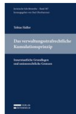
Das verwaltungsstrafrechtliche Kumulationsprinzip Ladenpreis: 59,00EUR