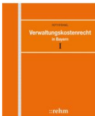
Verwaltungskostenrecht in Bayern Ladenpreis: 272,50EUR