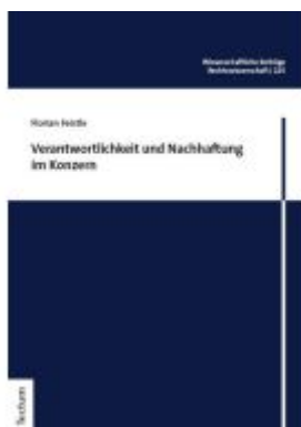
Verantwortlichkeit und Nachhaftung im Konzern Ladenpreis: 76,10EUR