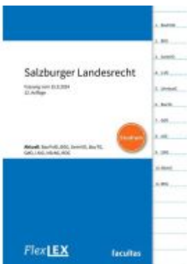
FlexLex Salzburger Landesrecht □ Studium Ladenpreis: 15,00EUR

Wir haben andere Produkte gefunden, die Ihnen gefallen könnten!