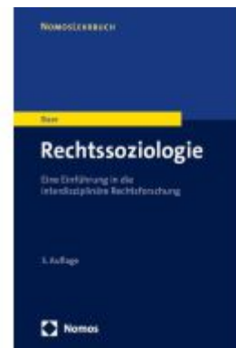
Rechtssoziologie Ladenpreis: 27,70EUR