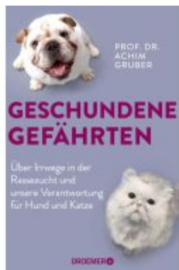
Geschundene Gefährten Ladenpreis: 21,60EUR