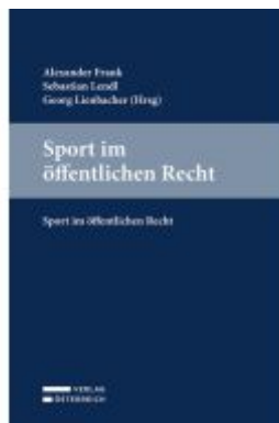
Sport im öffentlichen Recht Ladenpreis: 79,00EUR