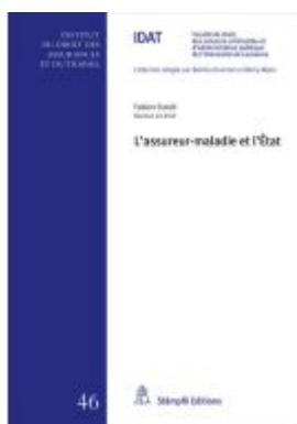
L'assureur-maladie et l'État Ladenpreis: 100,00EUR