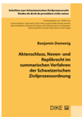
Aktenschluss, Noven- und Replikrecht im summarischen Verfahren der Schweizerischen Zivilprozessordnung Ladenpreis: 86,00EUR