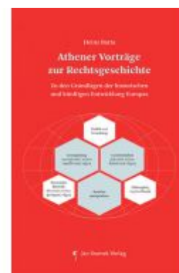
Athener Vorträge zur Rechtsgeschichte Ladenpreis: 29,90EUR