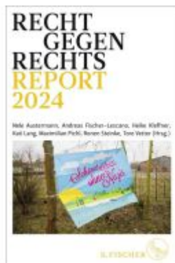
Recht gegen rechts Ladenpreis: 22,70EUR