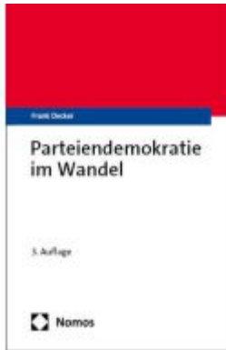
Parteiendemokratie im Wandel Ladenpreis: 35,00EUR