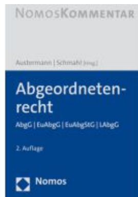
Abgeordnetenrecht Ladenpreis: 194,30EUR