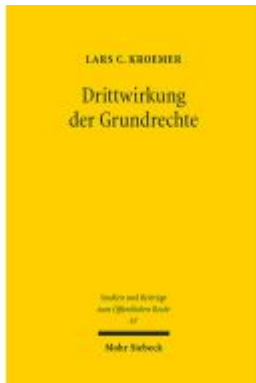
Drittwirkung der Grundrechte Ladenpreis: 76,10EUR