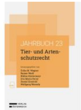
Tier- und Artenschutzrecht Ladenpreis: 78,00EUR