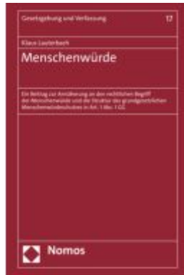
Menschenwürde Ladenpreis: 86,40EUR