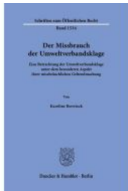
Der Missbrauch der Umweltverbandsklage Ladenpreis: 82,20EUR