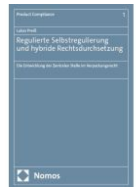
Regulierte Selbstregulierung und hybride Rechtsdurchsetzung Ladenpreis: 101,80EUR