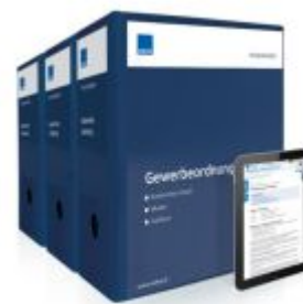
Praxiswissen Gewerbeordnung Ladenpreis: 283,80EUR