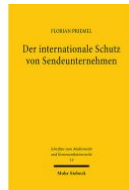
Der internationale Schutz von Sendunternehmen Ladenpreis: 91,50EUR