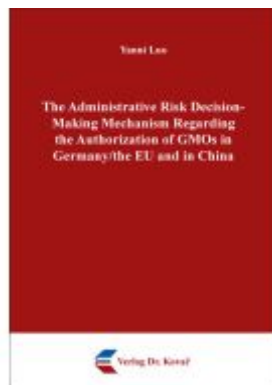
The Administrative Risk Decision-Making Mechanism Regarding the Authorization of GMOs in Germany/the EU and in China Ladenpreis: 97,60EUR