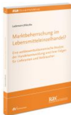
Marktbeherrschung im Lebensmitteleinzelhandel? Ladenpreis: 71,00EUR