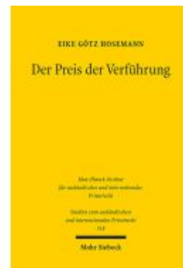
Der Preis der Verführung Ladenpreis: 81,30EUR