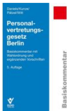
Personalvertretungsgesetz Berlin Ladenpreis: 55,60EUR