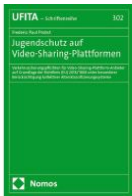
Jugendschutz auf Video-Sharing-Plattformen Ladenpreis: 204,60EUR