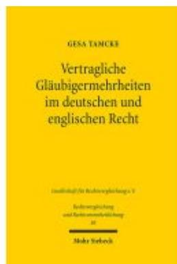
Vertragliche Gläubigermehrheiten im deutschen und englischen Recht Ladenpreis: 76,10EUR