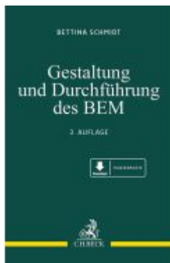
Gestaltung und Durchführung des BEM Ladenpreis: 60,70EUR