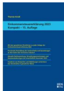
Einkommensteuererklärung 2023 Kompakt Ladenpreis: 56,50EUR