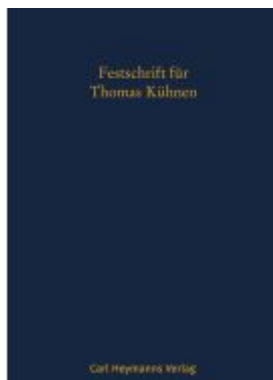
Festschrift für Thomas Kühnen Ladenpreis: 204,60EUR