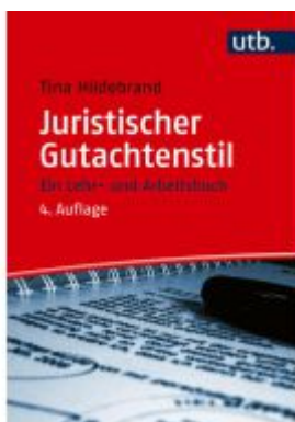
Juristischer Gutachtenstil Ladenpreis: 22,60EUR