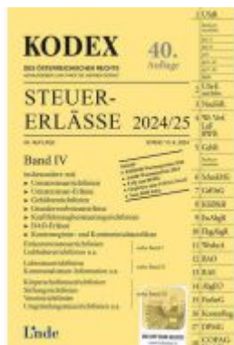
KODEX Steuer-Erlässe 2024/25, Band IV Ladenpreis: 67,00EUR

Wir haben andere Produkte gefunden, die Ihnen gefallen könnten!