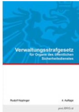
Verwaltungsstrafgesetz für Organe des öffentlichen Sicherheitsdienstes Ladenpreis: 11,00EUR