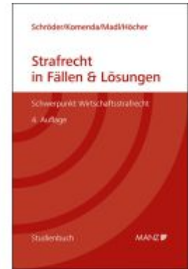
Strafrecht in Fällen & Lösungen Schwerpunkt Wirtschaftsstrafrecht Ladenpreis: 36,80EUR