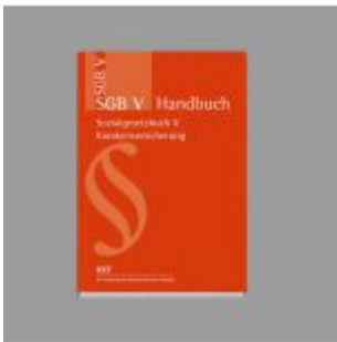
SGB V Handbuch Ladenpreis: 71,90EUR