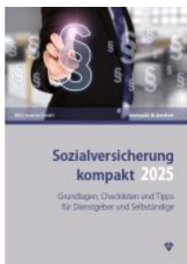
Sozialversicherung kompakt 2025 Ladenpreis: 31,90EUR