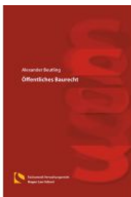
Öffentliches Baurecht Ladenpreis: 66,80EUR