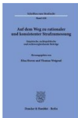
Auf dem Weg zu rationaler und konsistenter Strafzumessung Ladenpreis: 92,50EUR