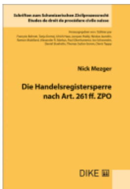
Die Handelsregistersperre nach Art. 261 ff. ZPO Ladenpreis: 90,00EUR