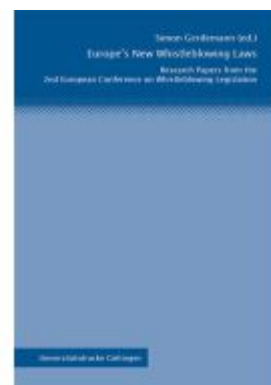
Europe's New Whistleblowing Laws Ladenpreis: 27,80EUR