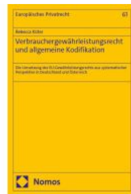
Verbrauchergewährleistungsrecht und allgemeine Kodifikation Ladenpreis: 122,40EUR