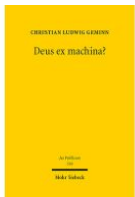
Deus ex machina? Ladenpreis: 148,10EUR