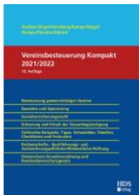
Vereinsbesteuerung Kompakt Ladenpreis: 113,00EUR