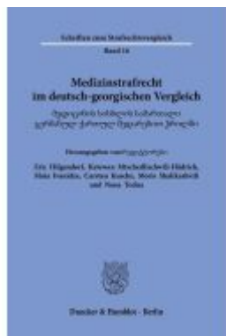
Medizinstrafrecht im deutsch-georgischen Vergleich. Ladenpreis: 113,00EUR

Wir haben andere Produkte gefunden, die Ihnen gefallen könnten!