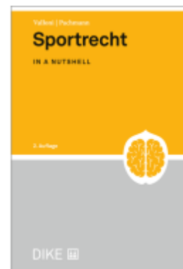
Sportrecht Ladenpreis: 52,00EUR