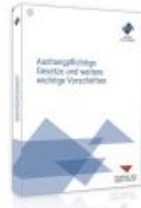
Aushangpflichtige Gesetze und weitere wichtige Vorschriften Ladenpreis: 55,60EUR