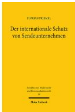
Der internationale Schutz von Sendeunternehmen Ladenpreis: 91,50EUR