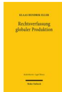
Rechtsverfassung globaler Produktion Ladenpreis: 102,80EUR