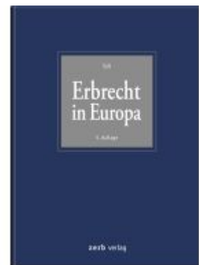
Erbrecht in Europa Ladenpreis: 204,60EUR