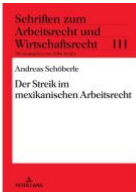
Der Streik im mexikanischen Arbeitsrecht Ladenpreis: 83,25EUR

Wir haben andere Produkte gefunden, die Ihnen gefallen könnten!