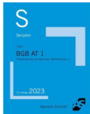
Skript BGB AT 1 Ladenpreis: 20,50EUR