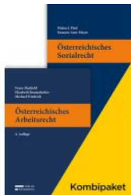
Kombipaket Österreichisches Arbeitsrecht und Österreichisches Sozialrecht Ladenpreis: 104,00EUR