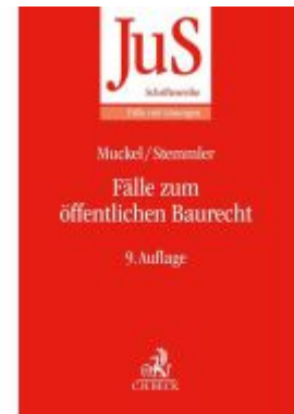
Fälle zum öffentlichen Baurecht Ladenpreis: 27,70EUR